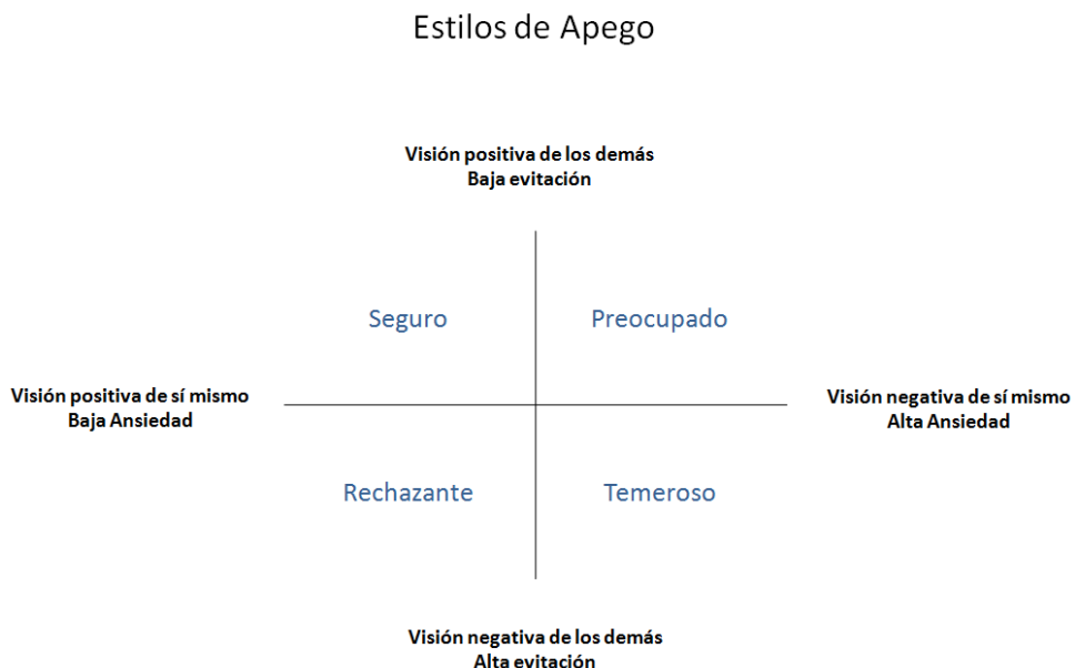
Figura 1. Modelo de Apego Adulto de Bartholomew y Horowitz (1991)

combinaciones. Estas combinaciones se han etiquetado como apego adulto seguro, preocupado, evitante y temeroso.