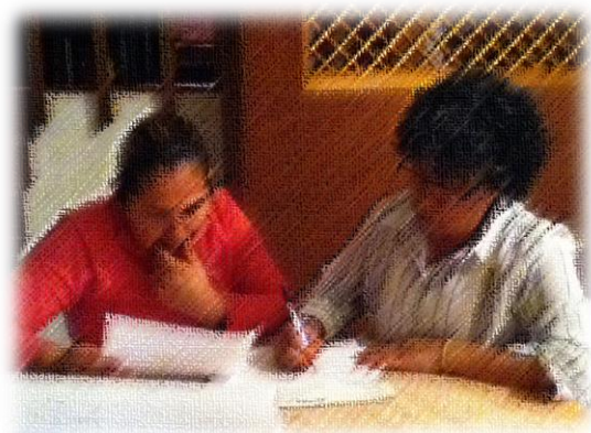
Diagnóstico previo al taller