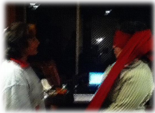
Reconocimiento de mi cuerpo