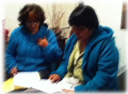
Evaluación del taller