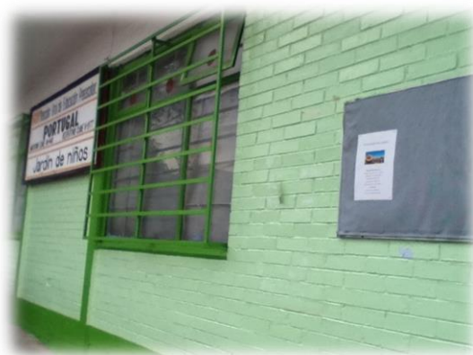
Convocatoria del taller en el preescolar