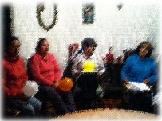
Dinámica grupal "Romper el hielo"