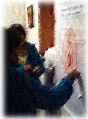
Identificando mis características sexuales internas