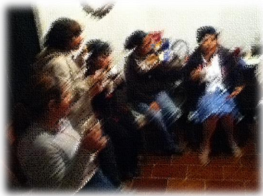
La tertulia, al finalizar el taller