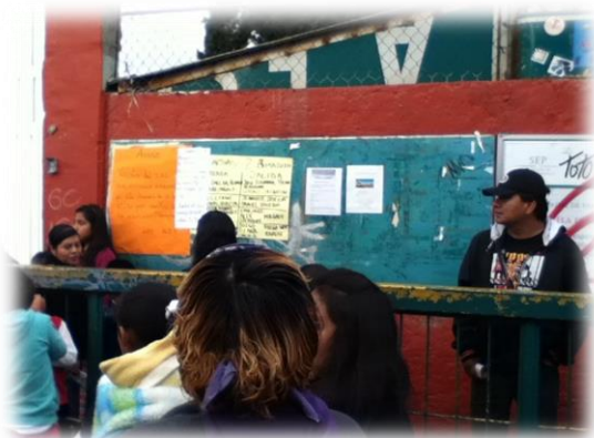
Convocatoria del taller en la primaria