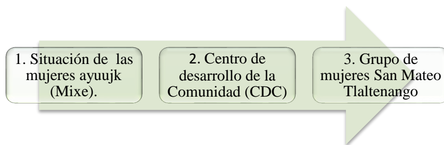
Figura 1. Fases del diagnóstico integrado en el estudio de caso.

El presente trabajo surge buscando interactuar con un grupo de mujeres en la ciudad de México, integrando la experiencia previa de la autora en dos grupos; se retomó una parte de los resultados del diagnóstico municipal que se realizó en el 2011 en la comunidad de Santa María Tlahuitoltepec, Oaxaca. El segundo fue un diagnóstico que se realizó en el 2014 en el centro de desarrollo de la comunidad en la Ciudad de México, con un grupo de mujeres cuyo propósito fue conocer las problemáticas que viven y a partir de las necesidades, diseñar un taller de intervención.