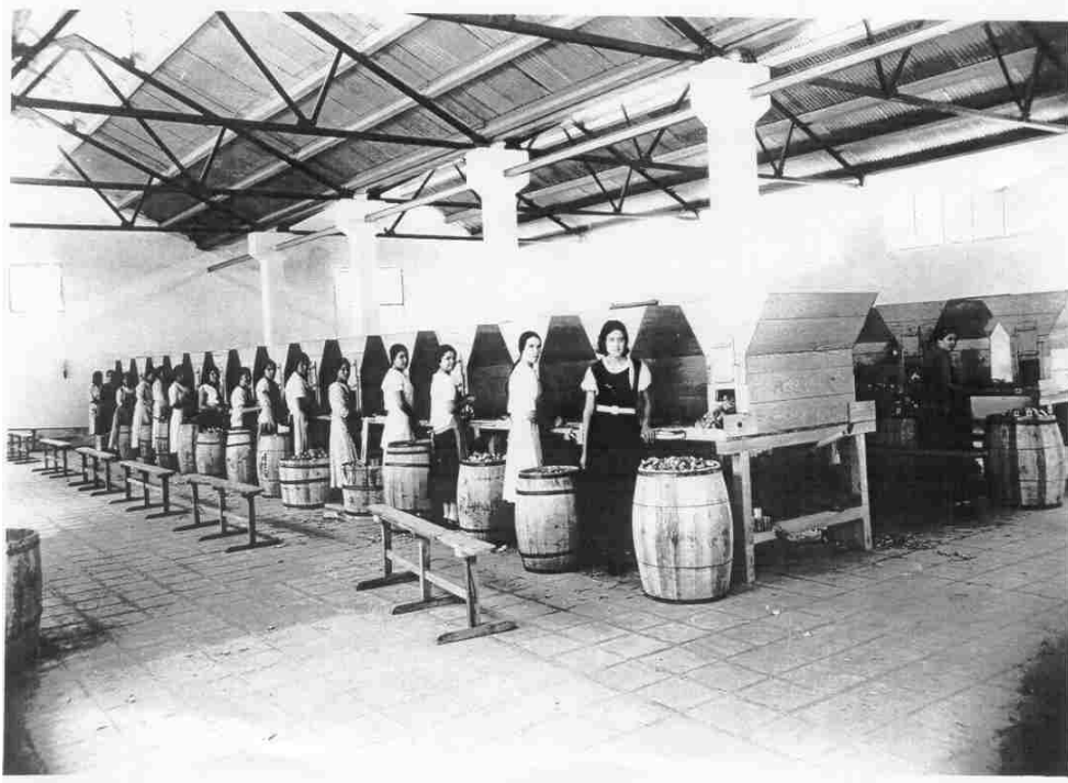
En la parte superior aparece una fotografía de las trabajadoras que se dedicaban al encajillado de fósforos en el año de 1935. En la parte inferior, aparecen las trabajadoras que se dedican al encajillado de fósforos y cerillos en 2003.