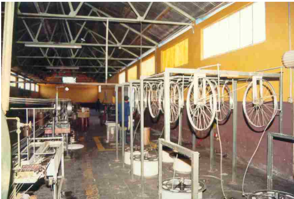
Máquina de embobinado de “hebra de pabilo” para elaborar las bobinas de alimentación de la máquina continua. Adaptación con materiales diversos. Máquina utilizada hasta la actualidad (foto: Manuel Basaldúa Hdez. 1999.)