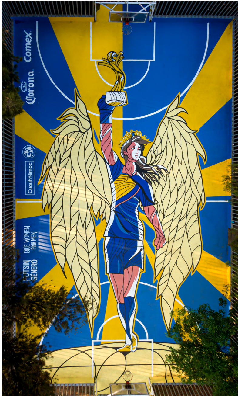
Figura 2. @akyanyme, Homenaje a las campeonas del Torneo de Apertura de Fútbol Femenil 2018 , 2018, © Blue Women Pink Men.