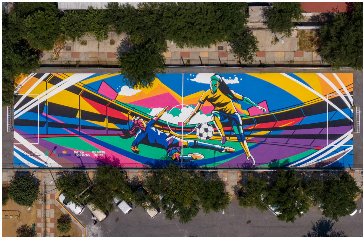
Figura 3. @akyanyme, pintura en Condominios Constitución, 2021, © Blue Women Pink Men.

apertura a la jugada (con el balón que la posibilita), y a la mirada femenina (con la forma ocular que enmarca y contextualiza la imagen). Así se alude tanto a la igualdad de género, como al arte como herramienta para promover el deporte; así se vincula el fútbol como experiencia lúdica y creativa.