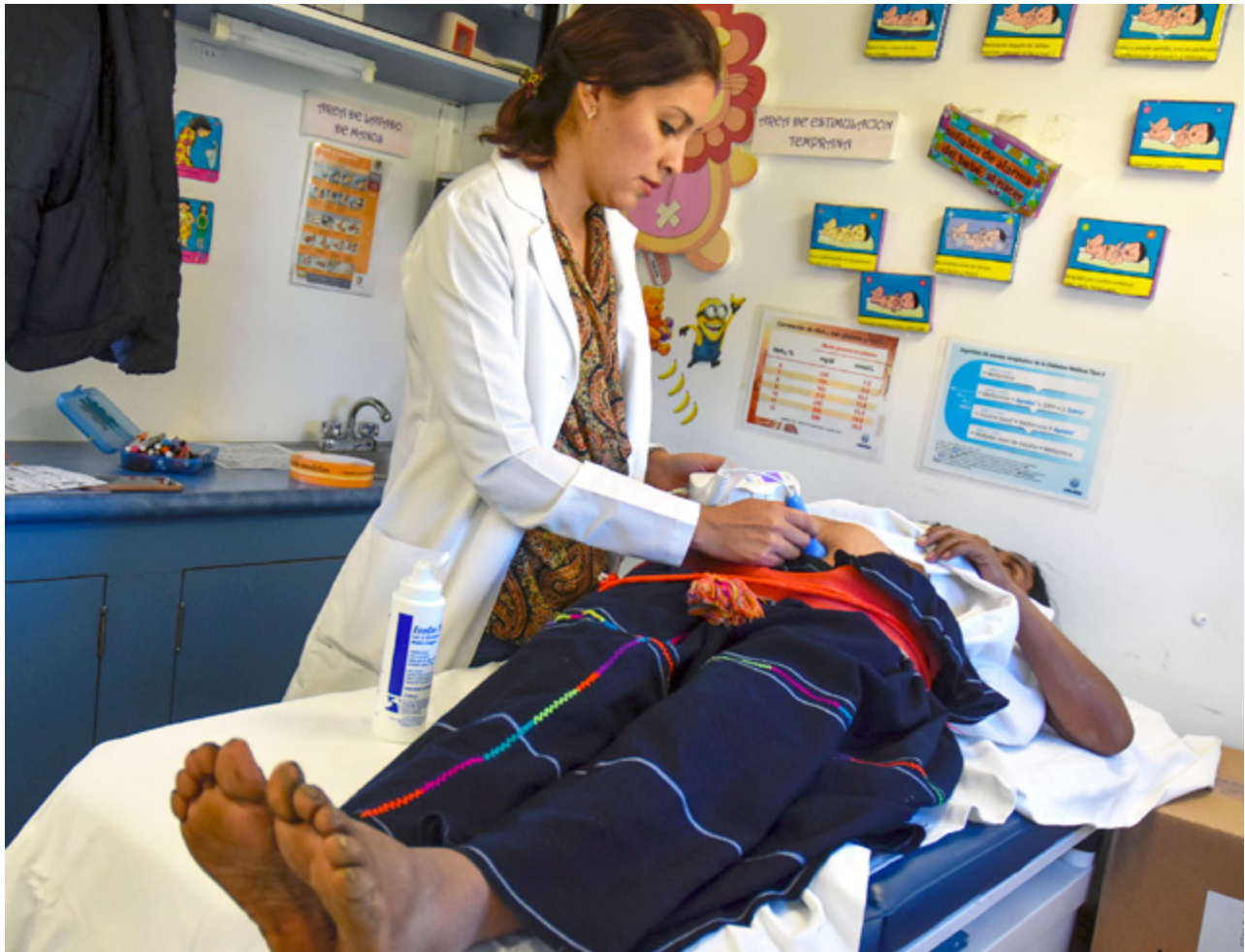
Doctora atiende a paciente embarazada en la región de la sierra chiapaneca. Febrero 2019.

manifestó tener acceso a la salud a través del SPS, comparado con el 26.9% que manifestó tenerlo a través del INSABI en 2020. Este deterioro en el acceso afecta desproporcionadamente a la población más pobre; el aumento en la carencia de salud es mucho mayor en los primeros deciles de ingreso y en los estados más pobres del país. 10