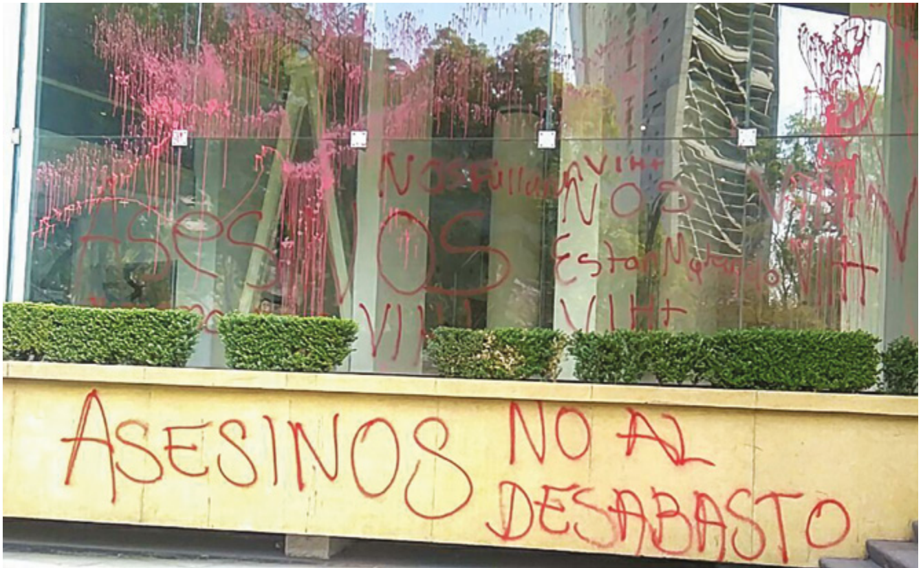
Pintas a manera de protesta frente a las oficinas del IMSS en Paseo de la Reforma ante la falta de medicamento para combatir el VIH, Ciudad de México. Febrero de 2020.