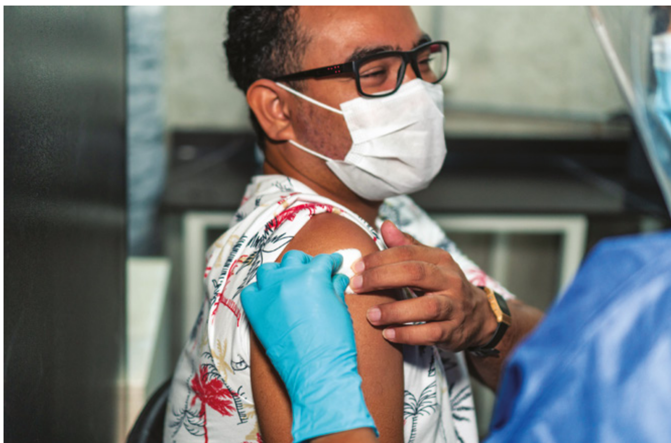
Personal médico aplicando la vacuna contra el COVID-19.

atención integral a esa población. Se crearon programas para beneficiarios de programas sociales focalizados, pero igual quedaban lejos de garantizar una atención de calidad y amplia cobertura de intervenciones 2 .