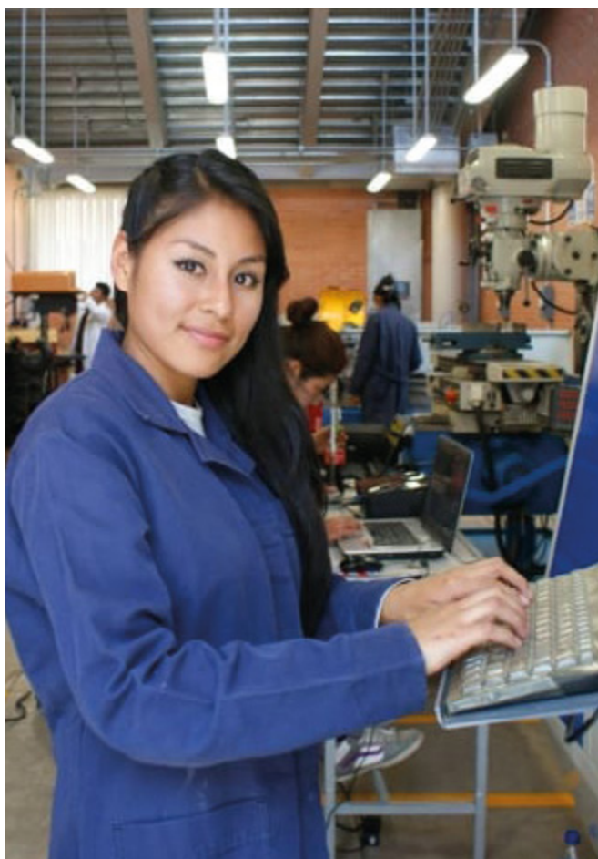
Actividades en uno de los laboratorios.

Las carreras de TSU, al tener un modelo 70% práctico y 30% de teoría, preparan al estudiantado para asumir los retos de un sistema socioeconómico altamente tecnificado y digitalizado que demanda profesionistas con habilidades y certificaciones orientadas a la solución de problemas tecnológicos que se presentan en el mundo de las profesiones tradicionales pero que se encuentran en permanente cambio e innovación.