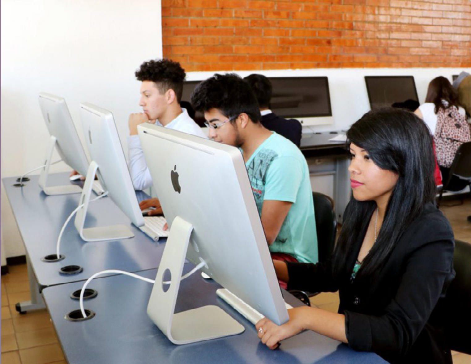
Actividades en las aulas con apoyo digital.

educativa, las personas egresadas de sus carreras de TSU pueden acceder a la licenciatura, cursando dos años más en una modalidad dual, es decir, mientras trabajan. Al tener el mismo estándar educativo, las personas que egresan en el mismo nivel educativo de otras universidades del SUJ, como de la Ibero Ciudad de México, también lo pueden hacer. La movilidad estudiantil entre las universidades está diseñándose longitudinalmente en las carreras de ingeniería como las TSU en Proceso de Producción, Mantenimiento y Mecatrónica para continuar sus estudios en una Licenciatura en Mecatrónica Industrial; o en las carreras de TSU en Sistemas Informáticos, Redes y Telecomunicaciones y Negocios Digitales, que podrán concluir con una Ingeniería en Tecnologías de la Información y Comunicación, si así lo deciden.