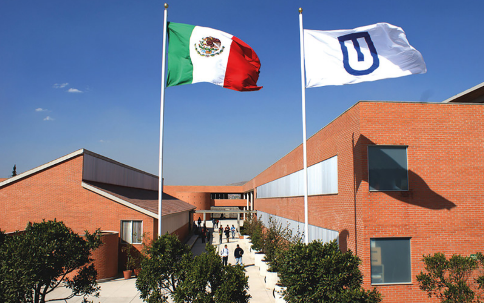
Tecnológico Universitario del Valle de Chalco, el TUVCH.

el cuidado de la Casa Común, llegar con una oferta pertinente a jóvenes de sectores vulnerables y marginados para que puedan contribuir al incremento de capacidades prácticas y competencias educativas y profesionales, con la misma calidad educativa y bajo los estándares de las demás universidades jesuitas. Las TSU son carreras que promueven los saberes prácticos profesionales que permiten a los estudiantes, en un corto tiempo –dos años y medio–, colocarse en el mercado laboral y experimentar la movilidad social de sus familias de origen o en formación.