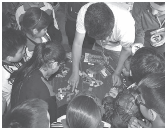
Foto tomada en la Asociación Cultural elgalpón.espacio, Pueblo Libre, durante el I Festival de Arte-Educación “Colectivos en acción por una cultura de paz”.