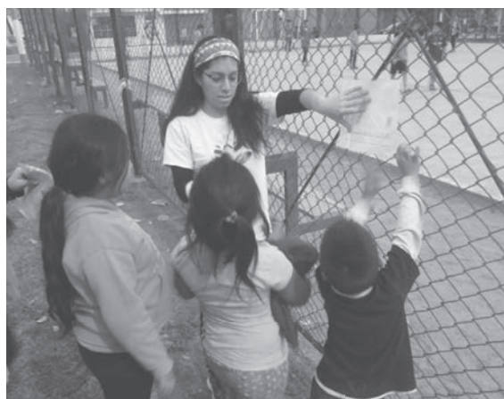
Foto tomada en el distrito Los Olivos, en Lima, de una actividad del proyecto Recreando tu Parque.