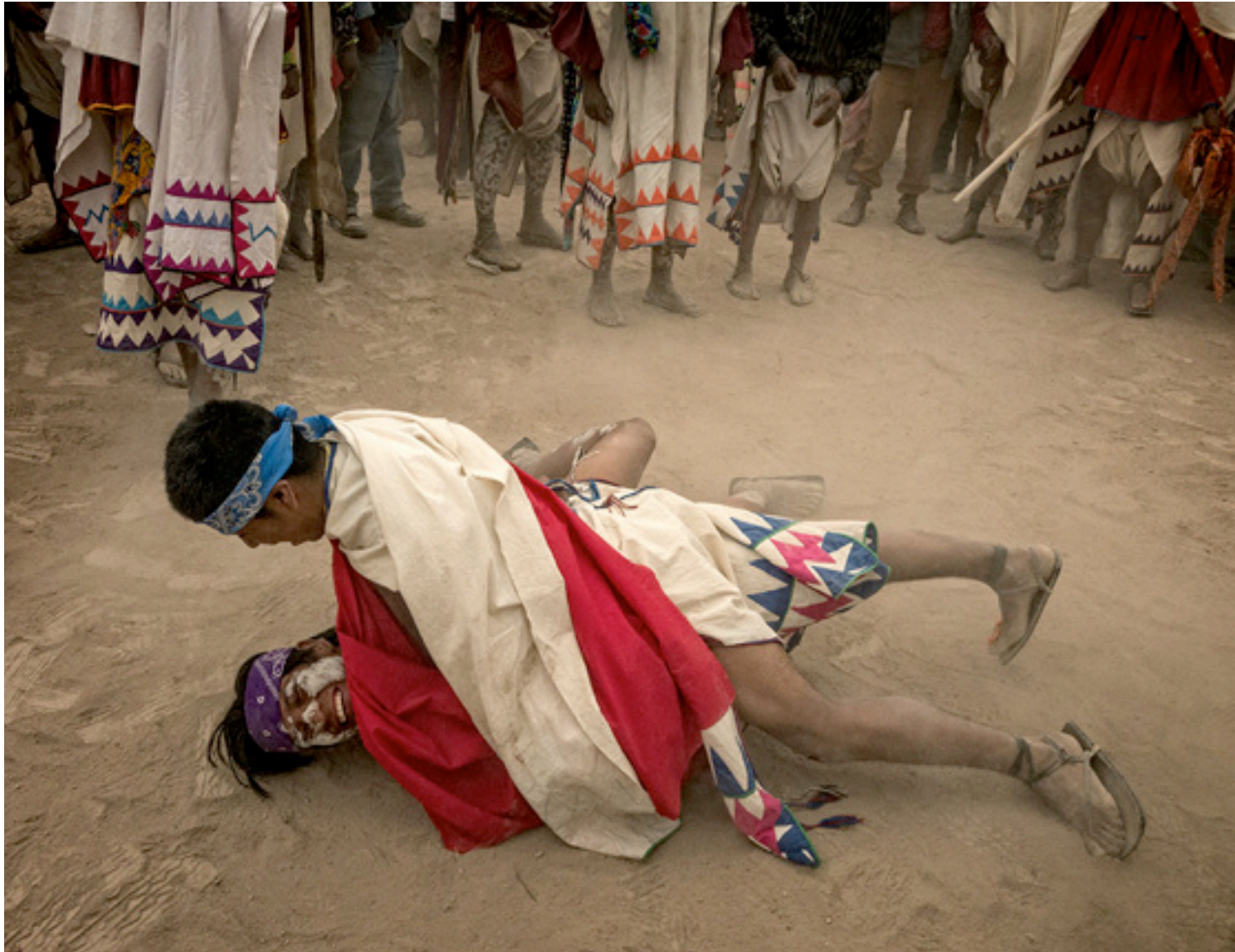
Tehuerichi, abril de 2015