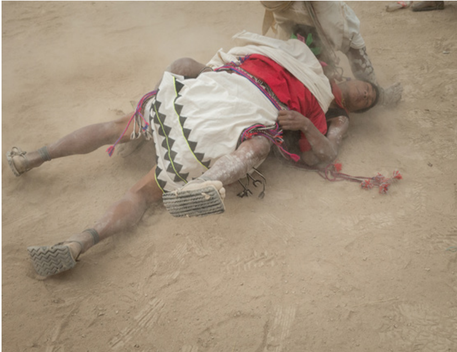
Tehuerichi, abril de 2015