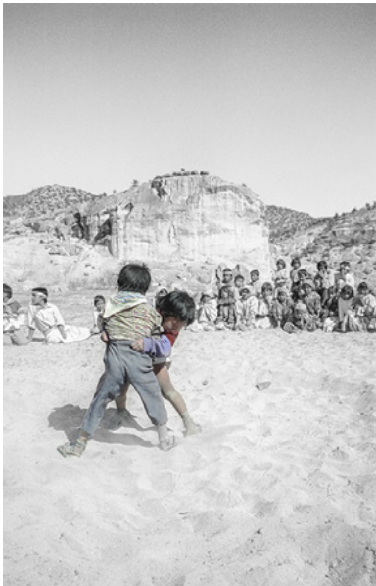
Tehuerichi, abril de 2002