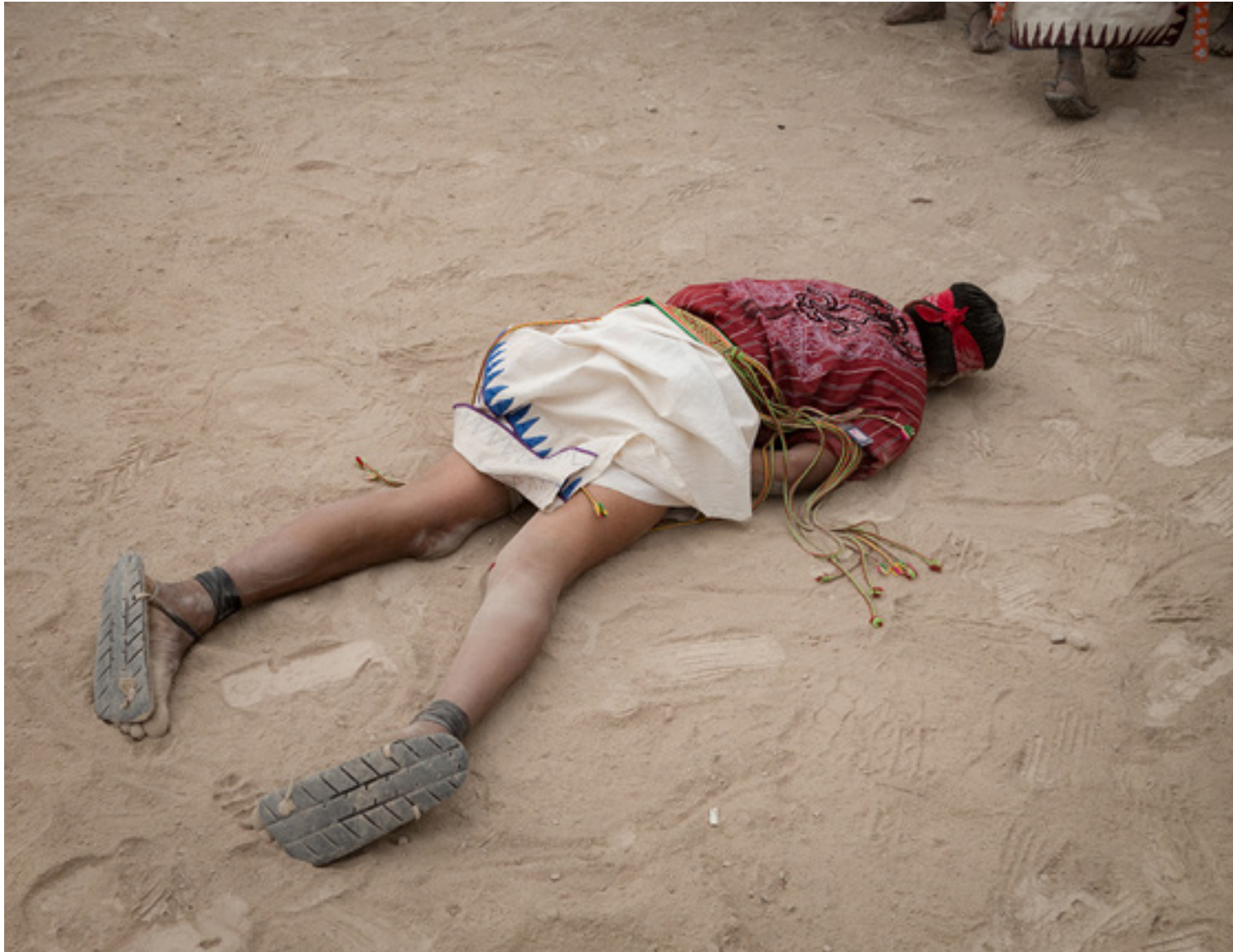
Tehuerichi, abril de 2015

Si bien no hay ninguna intención de lastimar al adversario, a veces sucede —como en el caso documentado en esta foto— que el contendiente resulte lastimado. Afortunadamente, el muchacho aquí retratado estaba de pie “como si nada” (como si nada hubiera ocurrido) a los cinco minutos.