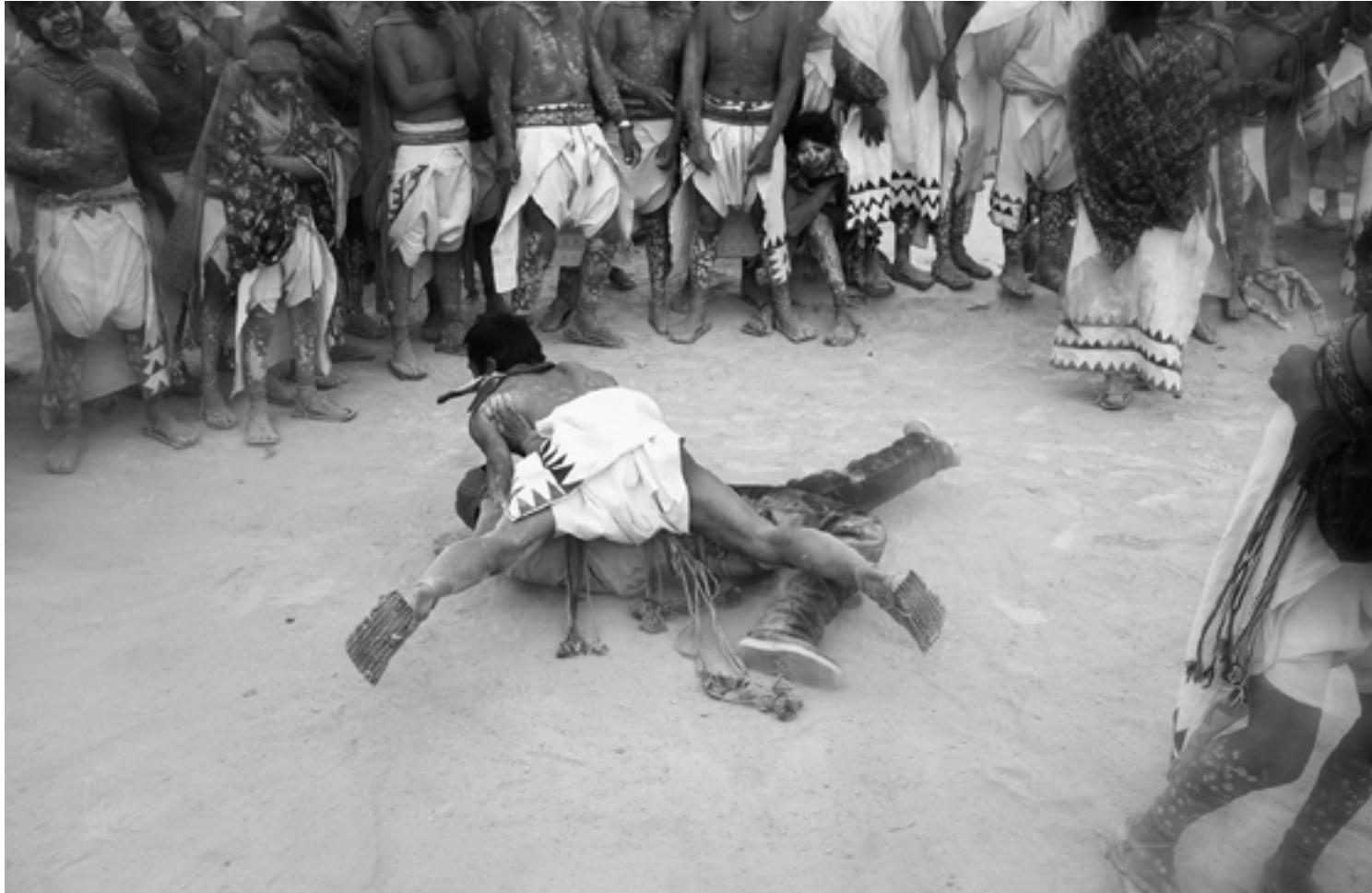
Tehuerichi, abril de 2015