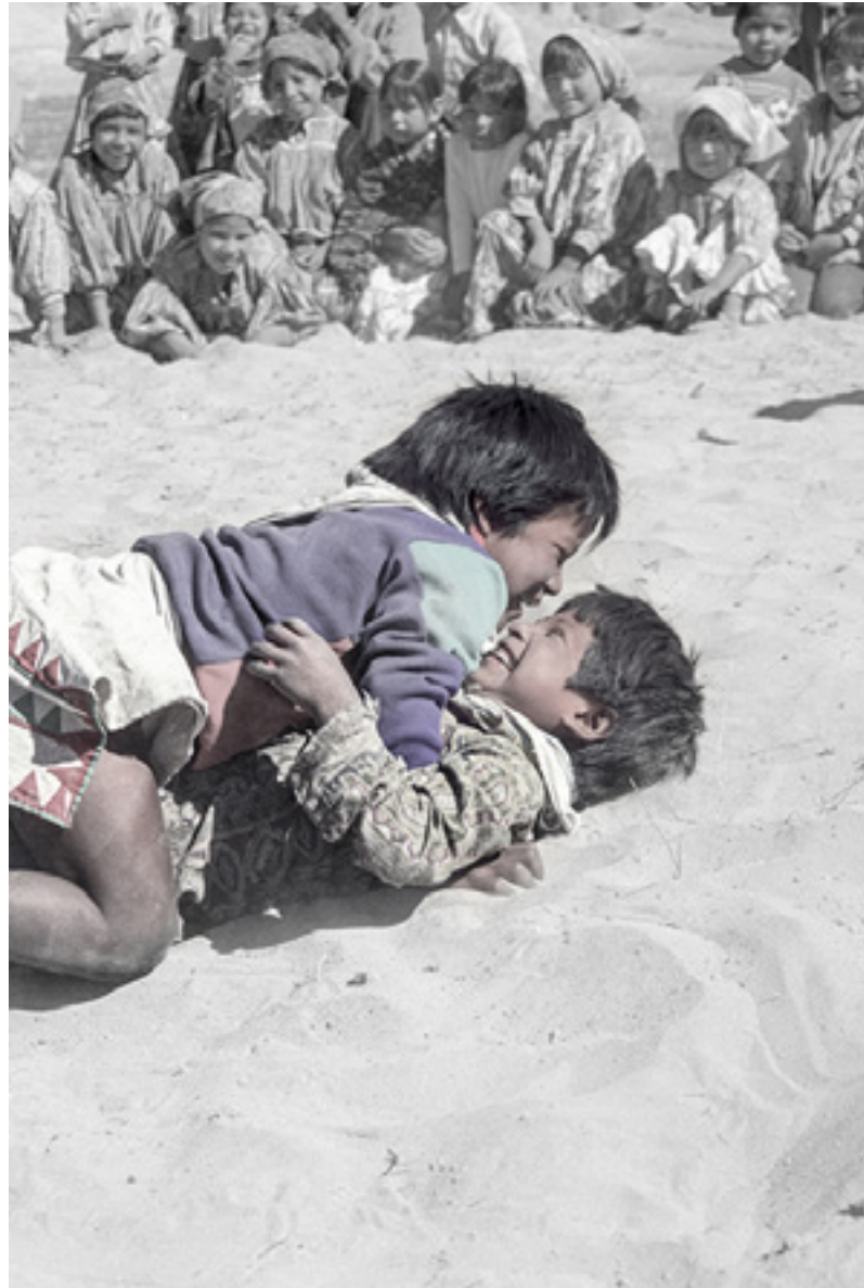
Tehuerichi, abril de 2002