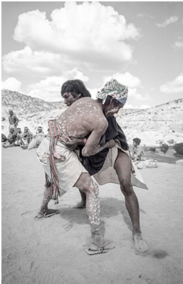
Tehuerichi, abril de 2004