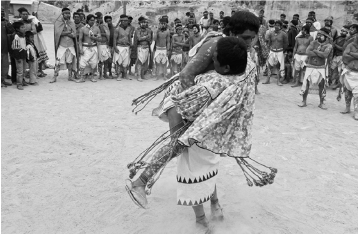
Secuencia 2. Tehuerichi, abril de 2015