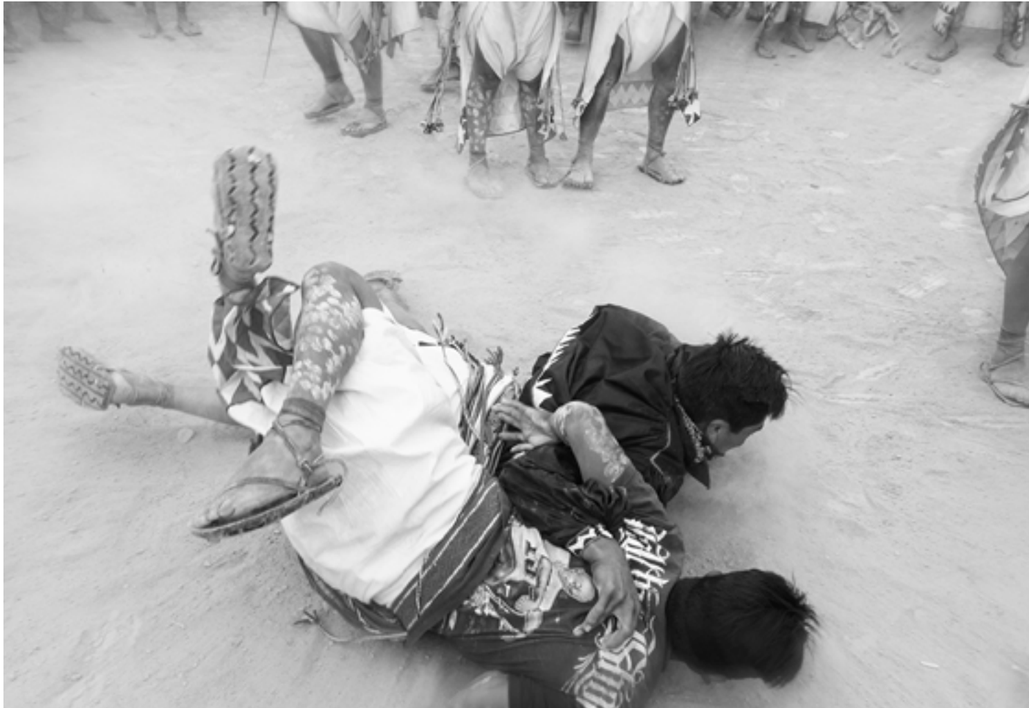
Tehuerichi, abril de 2015