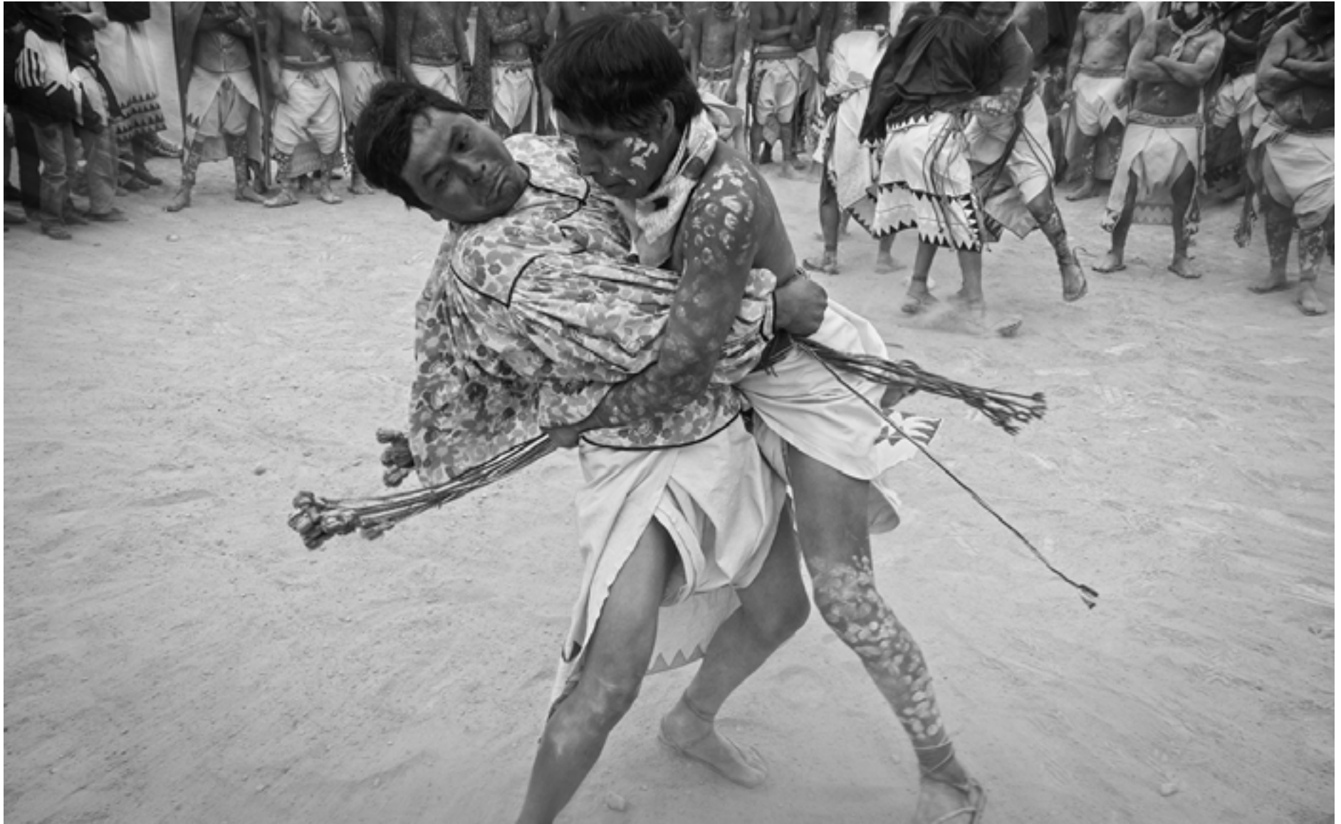
Secuencia 3. Tehuerichi, abril de 2015