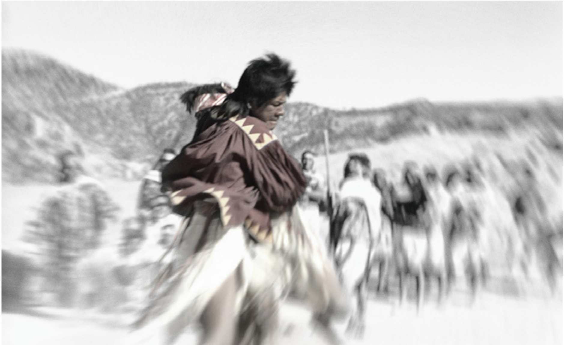
Tehuerichi, abril de 2015