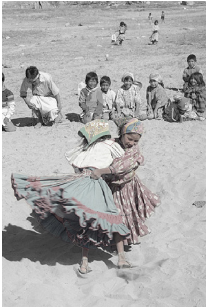
Tehuerichi, abril de 2002

En el contexto ritual, nunca he visto luchas entre mujeres por el simple hecho de que los bandos antagónicos que se enfrentan en el escenario están constituidos por hombres.