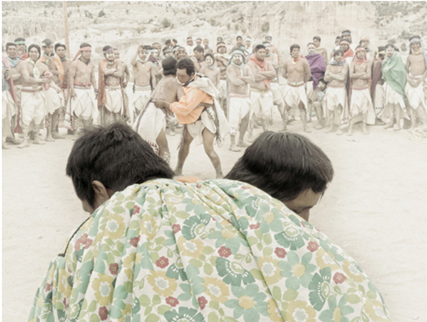
Tehuerichi, abril de 2015

Escenas de las luchas rituales con las cuales se concluye el ciclo de Semana Santa. Tal como se comenta en el texto, las luchas se realizan entre un Fariseo (reconocible por el torso desnudo) y un Soldado. El ganador será el que logre tumbar a su adversario de espaldas al piso. Si, dentro de un tiempo razonable, ninguno de los contendientes logra su propósito, el juez (el Capitán de los Soldados) declarará el empate.