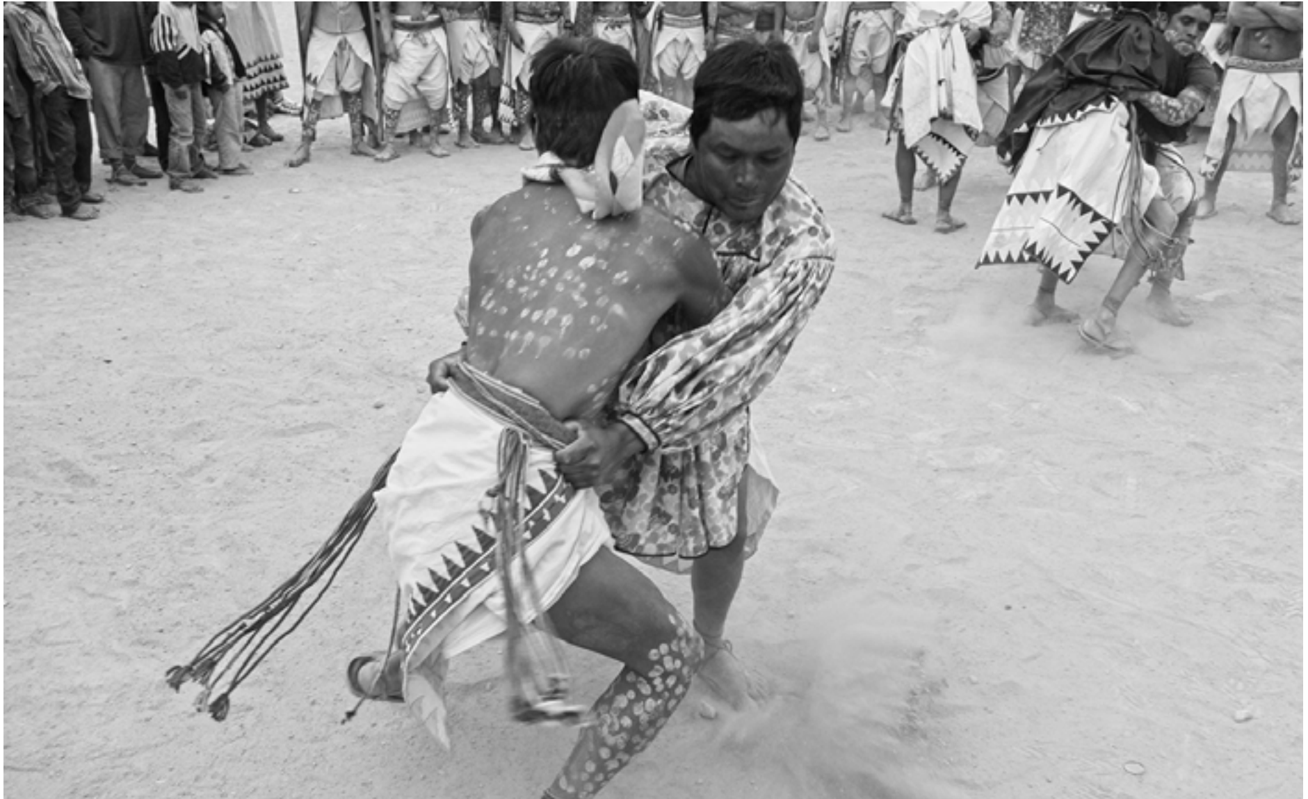
Secuencia 4. Tehuerichi, abril de 2015