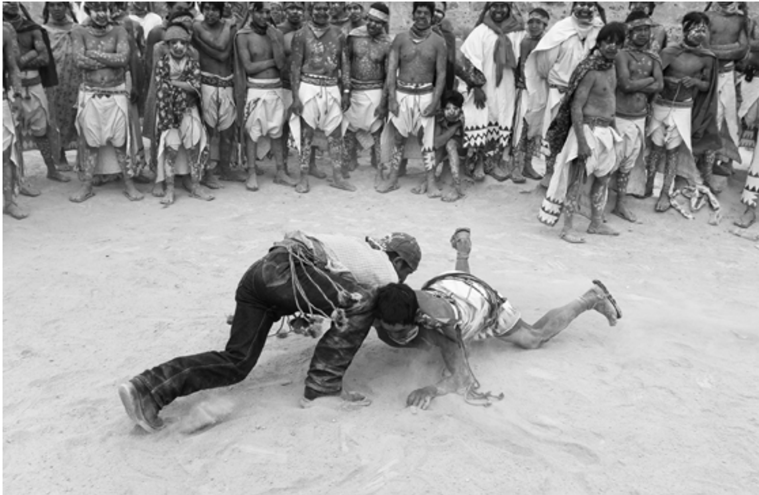
Tehuerichi, abril de 2015

En este caso, dado que ninguno de los contendientes termina con la espalda en el piso, la lucha recomenzará o bien será declarado el empate.