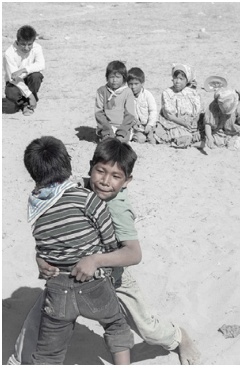
Tehuerichi, abril de 2002