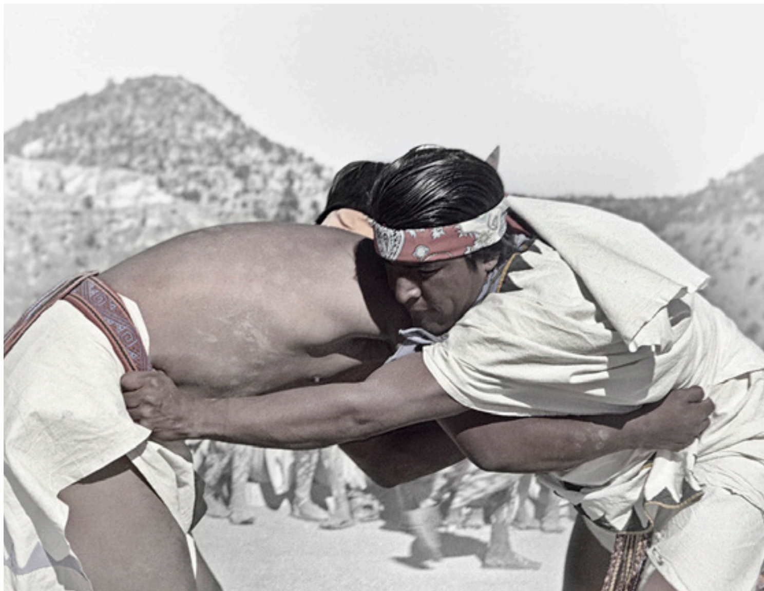
Tehuerichi, abril de 2015