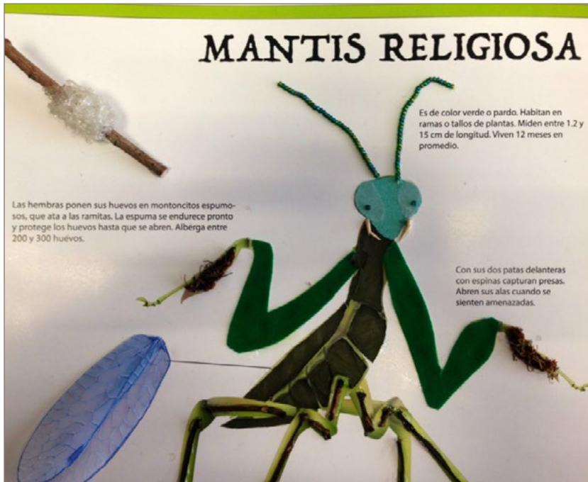
Imágenes 2, 3 y 4. Ejemplos de las monografías hápticas realizadas por alumnos de la materia de Diseño Tipográfico de la UAM Cuajimalpa en el trimestre 15P