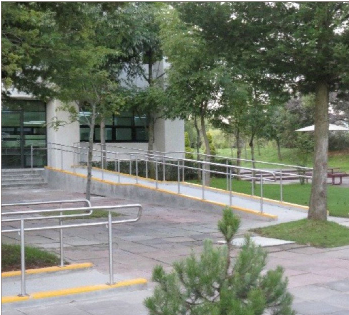
Imagen 1. Acceso frente a la cafetería, rampas agregadas recientemente con pendientes adecuadas, descansos y pasamanos.

de mamás sordas. Asimismo, el interés que esta jornada despertó en los alumnos de diseño de la Unidad Cuajimalpa fue tan significativo que actualmente se está desarrollando, a solicitud de los estudiantes, un programa anual de proyectos terminales para titulación sobre el tema de diseño y la discapacidad.