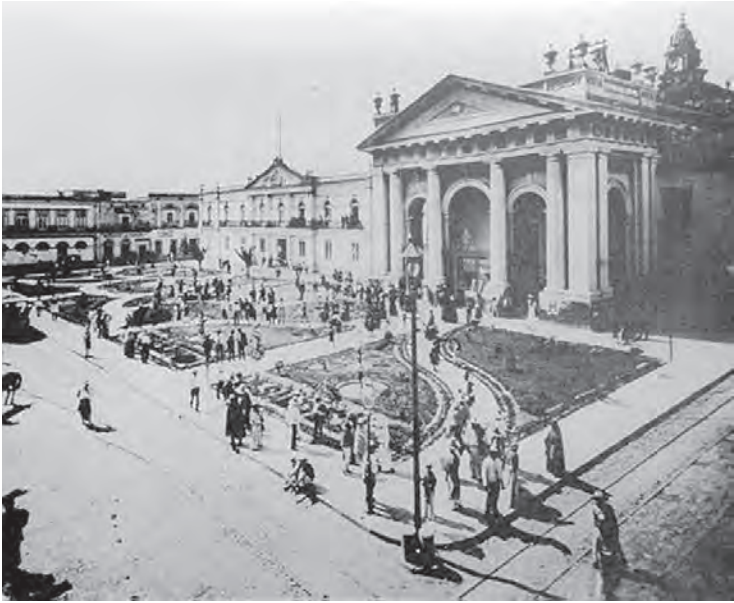
Antiguo Colegio de Santo Tomás, México, Fototeca Digital, Fondo: Parques y Jardines, 1886, imagen 001.