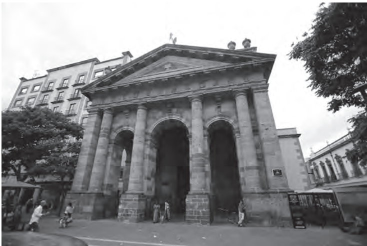
Restos del Colegio de Santo Tomás, 2017.