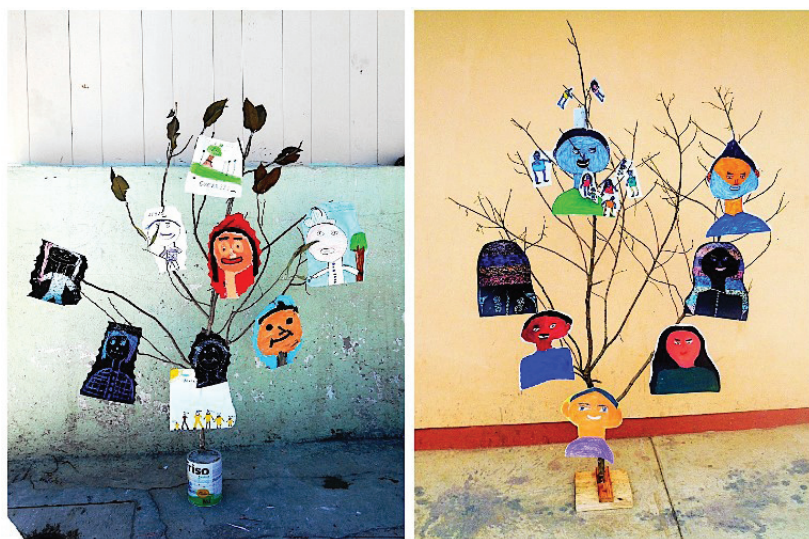
■ Figura 1: Árboles genealógicos

En el cuestionario realizado después de la actividad, con preguntas cerradas de opción múltiple, se pudo observar que a 55.5% de los alumnos de Chimalhuacán y a 59% de los de Guerrero represen-