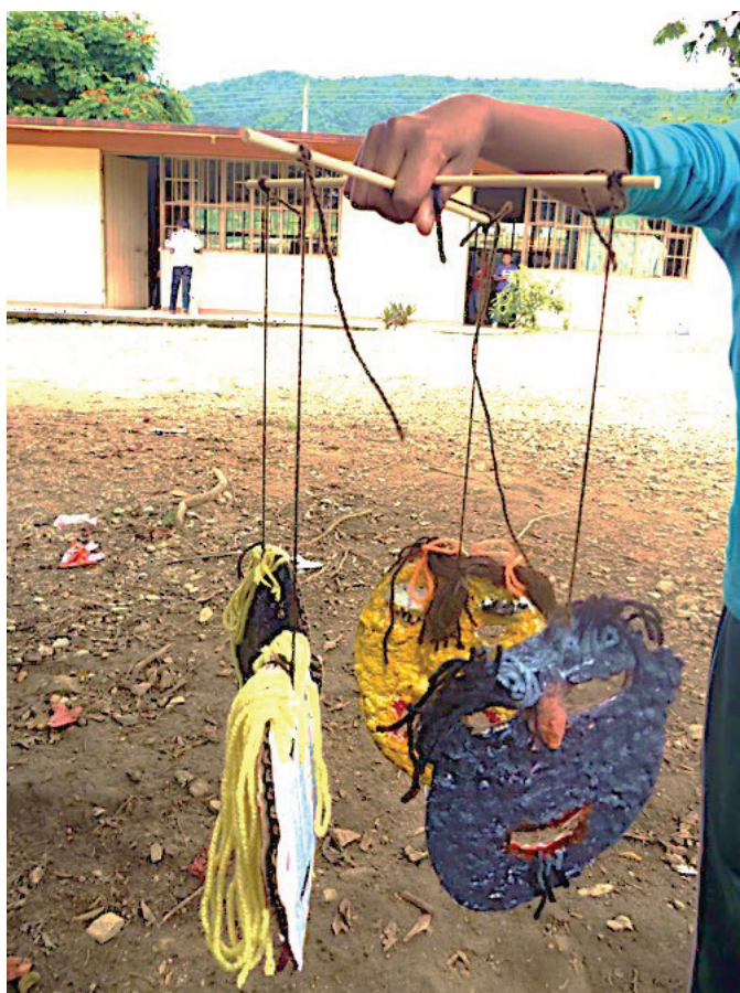
■ Figura 4: Móvil de los colores humanos

Por su parte, en la montaña de Guerrero, en relación con las representaciones sociales del grupo sobre las diferentes poblacio-