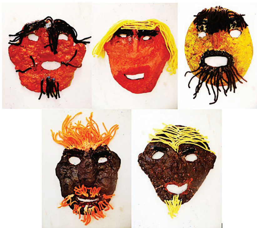
■ Figura 3: Máscaras

En Chimalhuacán, de acuerdo con lo arrojado en diferentes preguntas cerradas y de opción múltiple, 10 alumnos de los 30 que conformaban el grupo, es decir, casi 35 %, quisieran tener otro color de piel y entre esos 10, el 40 % representado por 4 de ellos, piensa que a alguien le va bien o no en la vida según sea su color de piel; 30% piensa que su color es feo o se avergüenzan de él, mientras otro 30% preferiría tener otro color, porque creen que así es la gente en otros países.