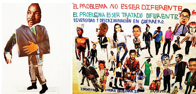
■ Figura 6: Collages sobre la diversidad y la discriminación, Chimalhuacán, Malinaltepec, Guerrero

Es muy notorio el contraste de cómo viven la identidad indígena en un contexto y en otro, ya que en la escuela de Guerrero, en general, no se advirtió vergüenza o negación de este origen sino, muy por el contrario, orgullo y dignidad, y sobre todo una gran naturalidad al respecto.