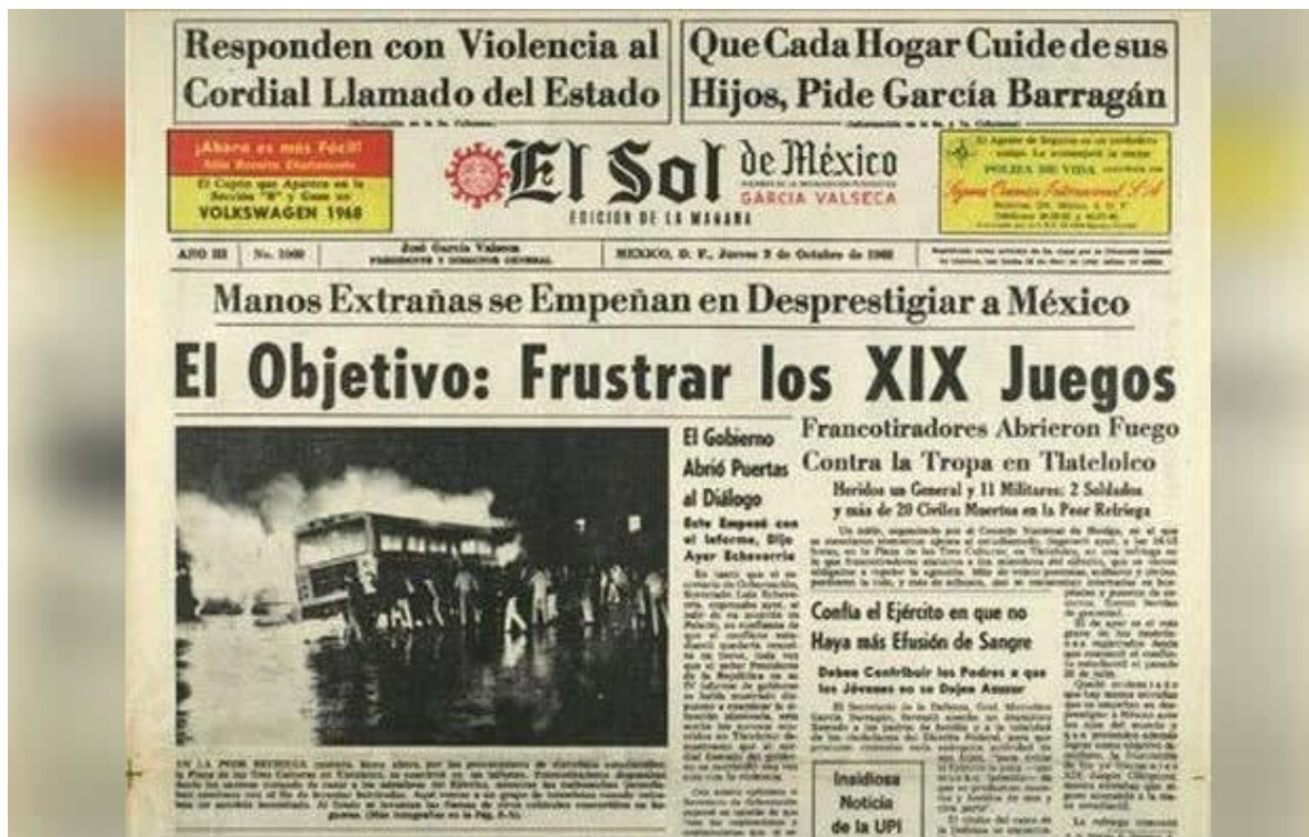
Fig. 10.0

Estas circunstancias empezaron a alimentar lo que analistas como Sergio Aguayo califican como la “paranoia política” de Gustavo Díaz Ordaz, quien tenía un odio por cualquier opositor al pensar que era una conspiración para desestabilizar al país. Tenía la idea de que los estudiantes eran grupos subversivos y al tener diferentes ideas de las que él tenía, traicionaban a la patria, provocando un complot internacional en contra de la nación. 169