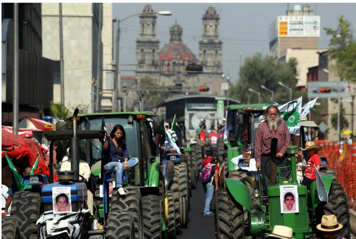
Fig. 13.0 La movilización social del Barzón integrada por caravanas de decenas de tractores y miles de campesinos llegando a Bucareli, recuperado de: http://amqueretaro.com/el-pais/2014/12/05/recibe-segob-comision-de-el-barzon/attachment/1004395494

cuales estaban siendo amenazados para embargarles sus bienes pero al afiliarse al Barzón consiguieron evitar este tipo de abusos por parte de las instituciones financieras. Esto significó un triunfo ya que el movimiento presionó al gobierno para que se diseñara una política de renegociación de las deudas y que se disminuyeran los saldos de todos los deudores, especialmente de la clase media. Posteriormente el movimiento se politizó pero a pesar de ello, sigue vigente hoy en día.