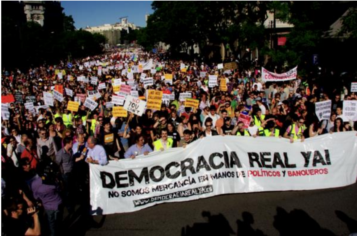
Fig.7.0 Crónica de Sociales, Los nuevos movimientos sociales están reinventando la política, recuperado de: http://cronicadesociales.org/2012/10/06/los-nuevos-movimientos-sociales-estan-reinventando-la-politica/

Tienen una lucha constante por los derechos humanos o en las afectaciones de la dignidad humana y a pesar de que muchos no logran sus objetivos, fracasen o desaparezcan, su importancia radica en que dejan semillas que en algún momento fructificarán ya que construyen espacios alternativos y generan nuevos valores donde su legado representa una esperanza transformadora porque tienen la posibilidad de crear un mundo diferente 162 .