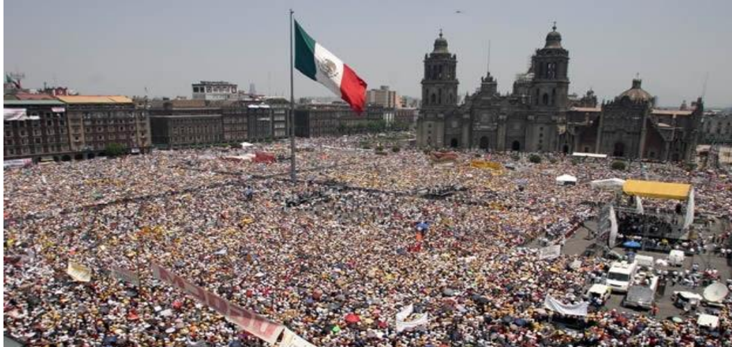
Fig. 14.0 CNN México, la marcha del silencio convocada por López Obrador en el año 2005

Dicho movimiento continuó después de las elecciones y los resultados irregulares electorales que dieron el triunfo al candidato del PAN Felipe Calderón Hinojosa, el cual fue liderado por el mismo López Obrador, quien luchó por la democracia electoral y el fraude en los comicios presidenciales de ese año.