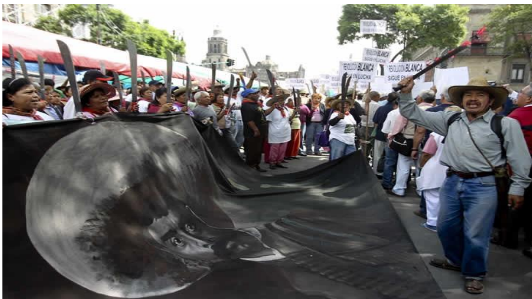
Fig. 16.0 Júbilo por la libertad de los 12, foto galería, recuperado de: http://fotos.eluniversal.com.mx/coleccion/muestra_fotogaleria.html?idgal=8545

puedan reconocer como tales. La identidad define todo aquello que es común a sus integrantes y lo que los ha motivado a organizarse, lo cual genera criterios que giran alrededor del propósito que los une. También forman intereses particulares y específicos que se expresan para identificar su naturaleza, al manifestar sus aspiraciones que lo hacen tener fisonomía propia que lo diferencia de otros movimientos sociales. Asimismo, el tener una estructura interna sólida ayuda a mantener la adhesión, dinamiza la acción y garantiza su permanencia. Por último, es necesario ser guiados por un líder y una minoría dirigente que se encargue del buen funcionamiento como tal y una mayoría que lo siga, que los apoye y que tengan confianza en ellos, como una manera de identificación y representación 185 .