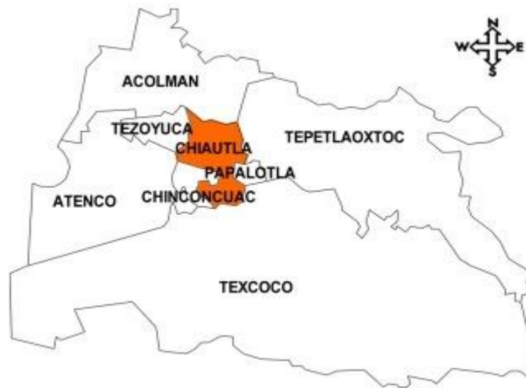
Fig. 2.0 Mapa demográfico del Municipio de Atenco y su colindancia 69

En la actualidad, un gran número de los pobladores de Atenco carecen de los servicios más indispensables ya que de sus más de 6 mil viviendas, una parte no tiene agua potable, drenaje ni luz 68 , convirtiéndolo en una de las zonas con mayor pobreza del Estado de México.