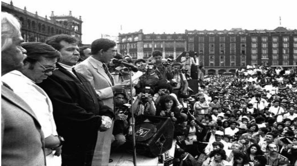
Fig. 11.0 Enrique Huerta Cuevas, Archivo de la etiqueta; Frente Democrático Nacional. La unificación de las "Izquierdas".

la economía neoliberal. De este mismo movimiento, en 1989, surgió el partido de Izquierda PRD (Partido de la Revolución Democrática) 174 aún vigente. (Fig. 11.0)