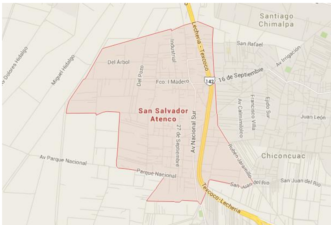
Fig. 1.0 Mapa de San Salvador Atenco, recuperado de: https://www.google.com.mx/maps/place/Atenco,+M%C3%A9xico/@19.5434425,-98.95366,13z/data=!3m1!4b1!4m2!3m1!1s0x85d1ef37d4e1d1b5:0x8dc3f1e6c5ee03c5

El municipio de Atenco está integrado por La cabecera Municipal donde se ubica el Pueblo de San Salvador Atenco; Los Pueblos , conformados por este último y por San Francisco Acuexcomac, San Cristóbal Nexquipayac, Santa Isabel Ixtapan y Zapotlan 64 . Además está compuesto de Colonias y Caseríos . (Fig. 1.0)