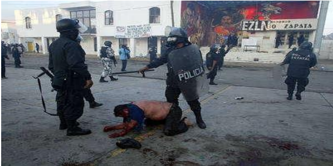
Fig. 3.0 Villaseca, Jesús. Los cuerpos de seguridad reprimieron la protesta en San Salvador Atenco en 2006