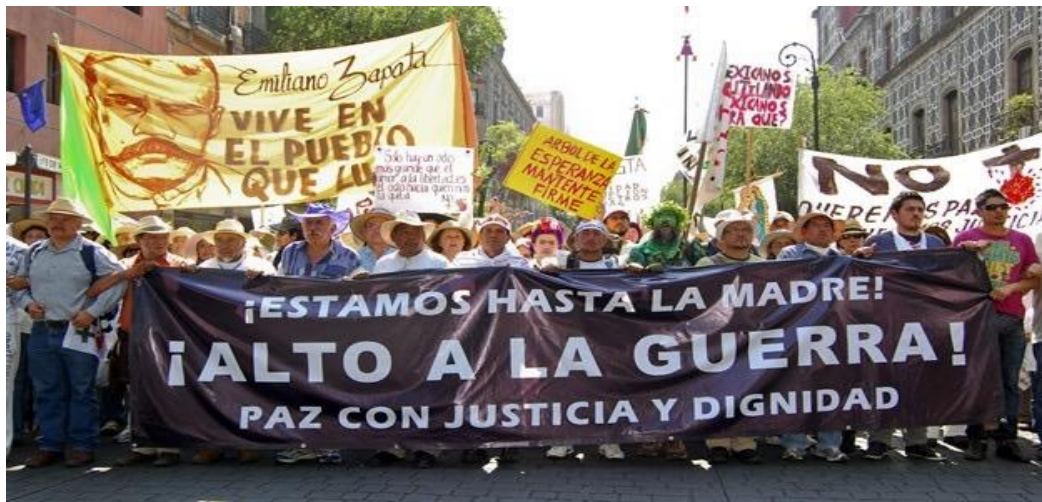
Fig. 15.0 CNN México, Los momentos clave del movimiento por la paz a dos años de su inicio

El 28 de marzo de 2011 nace el “Movimiento por la Paz con Justicia y Dignidad” encabezado por el escritor y poeta Javier Sicilia, después del asesinato de su hijo y dos de sus amigos (hecho lamentable ocurrido en el estado de Morelos) y en protesta a la guerra contra el narcotráfico impulsada por el gobierno panista que dejó durante el sexenio de Felipe Calderón, miles de muertos y desaparecidos, el cual logró convocar centenares de personas en una marcha hacia el zócalo capitalino para anunciar un Pacto Nacional. 180 (Fig. 15.0)