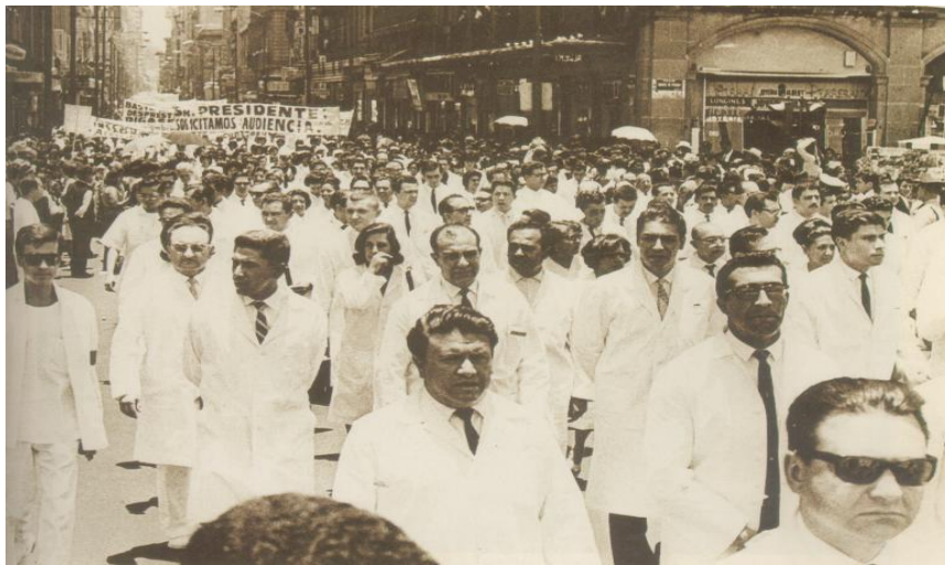
Fig. 8.0 Memoria Política de México. Se organizan los médicos residentes e internos del sector salud, 27 de noviembre de 1964.

De 1964 a 1965 surgió la AMMRI 164 (Asociación Mexicana de Médicos Residentes e Internos) una movilización de médicos formada por Doctores y residentes que solicitaron mejoras en sus centros de trabajo iniciando con un paro de labores en el Hospital 20 de noviembre del ISSSTE debido a que no les pagaron aguinaldos. Posteriormente se fueron sumando a esta causa, médicos de otros hospitales así como alumnos de medicina de la UNAM. (Fig. 8.0)