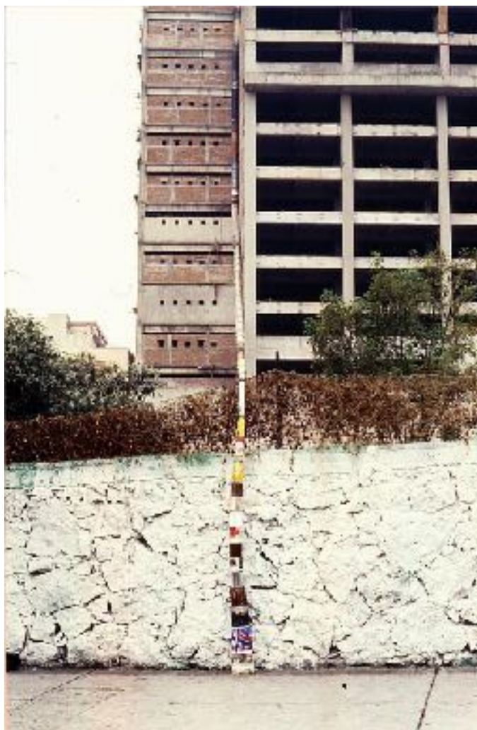
Figura 1.7 Tráfago, 1995-2004, impresión digital, 25.4 x 20.3 cm.

ávidas de nuevas identidades y nuevas diferencias, porque es un hecho que la gente quiere vivir en seguida, aquí y ahora, lo cual origina una nueva concepción de cultura que abandona los grandes sistemas de sentido que diluye los límites de lo local, lo regional y lo global (Guilles Lipovetsky, “L’ere du vie. Essais sur l’individualisme contemporain”, 1983), creando una fantasía de su propia realidad degenerada; tan pervertida que no hace más que volver mucho más interesante la reglas del juego de la vida.