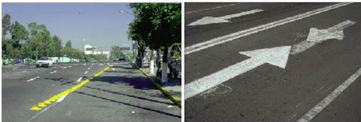
Figura 1.1 Conozca México III (topes-flechas) , 1996-2000, dos impresiones a color, 40.6 x 50.8, cortesía Galería Kurimanzutto, México

había cumplido con la obligación de renovar, reconvertir o directamente crear un nuevo equilibrio entre lo general y lo particular, como una manera de incitar a la reflexión de nuestro presente inmediato.