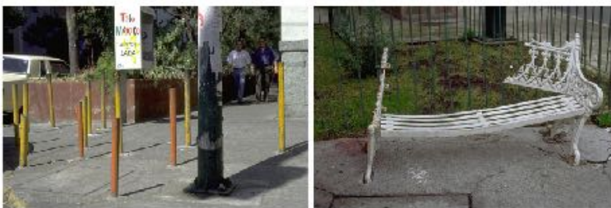
Figura 1.2 Conozca México I (postes-banca) , 1996-2000, dos impresiones a color, 40.6 x 50.8, cortesía Galería Kurimanzutto, México