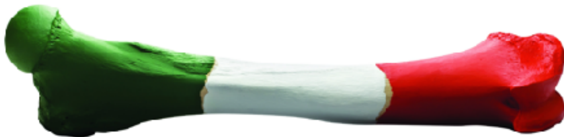
Figura 1.6 Fémur de Elefante Mexicano , 2010, hueso y pintura, 38.58 x 10.83 x 7.48 pulgadas. Cortesía RM + Musée d'art Moderne de la Ville de Paris + Museo Amparo

década y media de la transición de un siglo a otro no resulta sencillo explicar el desarrollo del arte posterior al siglo XX, sobre todo cuando el incremento de productores y de propuestas es excesivo, cuando las social networks se vuelven una extensión inmaterial de nuestra existencia diaria, y, resurge una confusión de discursos en lo político, lo económico, lo moral y lo estético. Sin embargo, tal parece que nos encontramos en la cúspide de nuevas posibilidades de lo estético, siendo el arte mexicano actual un fenómeno que se fecunda a través de las paradojas de lo actual y lo inmediato y la cultura basada en lo fútil.