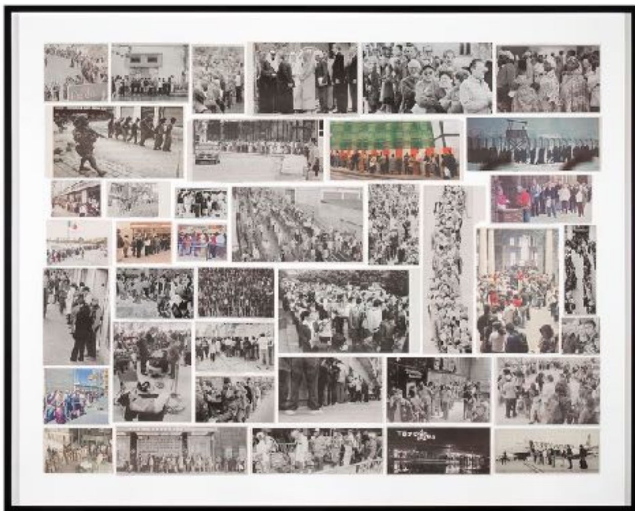
Figura 3.3 Vulnerabilia (filas), 2008-2010, collage sobre cartulina, 87.5 x 130.3 x 4 cm.