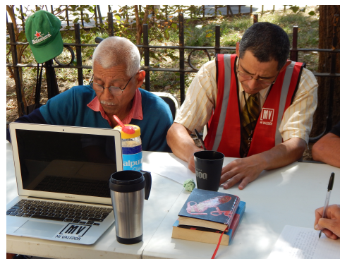
Fotografías del taller, por Ramón Beltrán Sabalza (PRENDE Universidad Iberoamericana, 2017)