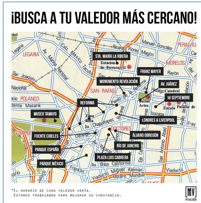
Imagen extraída de Facebook oficial de la revista “Mi Valedor” sobre los puntos de venta de la publicación: https://www.facebook.com/mivaledor/photos/a.464935163602871/1803699029726471/?type=3&theater (Publicada el 22 de agosto del 2018)