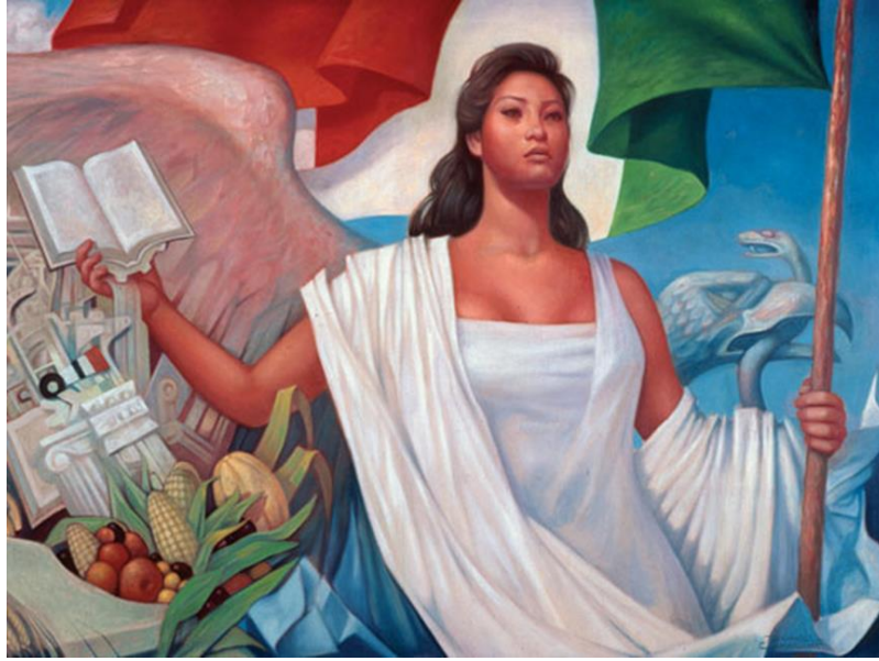
La Patria (1961)

En este apartado hemos expuesto el significado de cada peculiaridad que contiene La Patria para identificar las semejanzas en las distintas interpretaciones de la pintura. Por medio de dicha técnica, buscamos el medio que tiene en común con la otra información del significado de cada elemento que presenta la pintura. Además, nos cuestionamos si esos elementos significan en la actualidad lo mismo y por qué siguen siendo parte importante en la memoria.