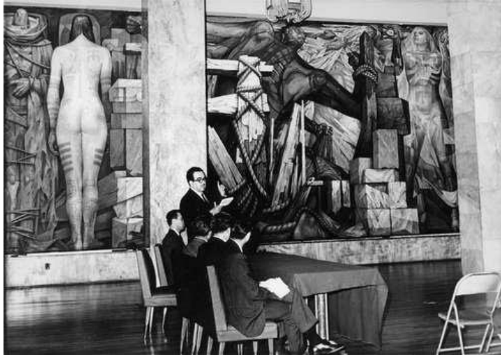
Díptico de la vida, lado derecho de la fotografía.

González Camarena creó alrededor de 30 murales, entre los que destacan Germinación (1944); Don Quijote de Monterrey (1945); La industria, la banca y el comercio , Cristo sobre la cruz , San Felipe de Jesús (los tres de 1946), La erupción del Xitle (1947), La vida y la industria (1949), México, el trabajo y la modernidad (1950) Águila en Vuelo , El Triunfo de la Cultura (ambos de 1954), Historia de México (1955), Belisario Domínguez (1957), Revolución constructiva (1958), Frisos de la televisión (1959) y Alegoría de la Ciencia y de la Comunicación (1960).