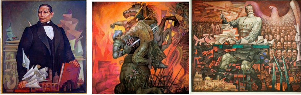
Benito Juárez (izquierda) La Constitución de 1917 (centro) y Venustiano Carranza. La Conquista (derecha).

La obra La Conquista (conocida también como La Fusión de Dos Culturas ), apareció en los billetes de cincuenta mil pesos a finales de la década de 1980 y principios de 1990. También una institución bancaria la grabó en medallas elaboradas en plata y oro en una edición conmemorativa de los cinco siglos del descubrimiento de América 21 . Como se ha mencionado aquí, la simbología y la plástica artística mexicana de González Camarena fue representativa de un nacionalismo que se instituyó en la vida cotidiana de las personas, usándose en lo político, en lo educativo y en lo económico del México de aquella época.