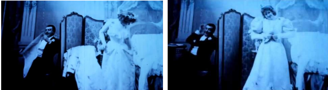
Fig. 8. Albert Kirchner. Le coucher de la mariée . Película. 7'. 1896. Francia.

la lente del recién inventado cinematógrafo dentro de una alcoba para capturar una escena de sexo explícito, en tiempo real.