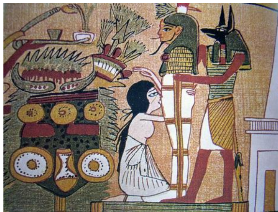
Fig. 10. Mito de la resurrección de Osiris. Papiro datado alrededor del siglo I a.C. Museo Británico.

A pesar de la distancia histórica y los contextos dispares, la operación realizada por Linda aún guarda algunas reminiscencias del misticismo egipcio: comparte vida a través del blow-job , el epicentro de su placer sexual, pero en el fondo yace como único objetivo resolver sus propios predicamentos, una alternativa que fue incapaz de conjeturar por sí misma hasta que un sexólogo, el nuevo Osiris californiano, le hizo notar.