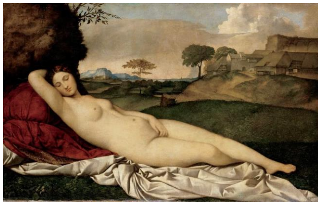
Fig. 1. Giorgione. Venus dormida . Óleo sobre tela. 108,5 cm x 175 cm. Hacia 1507-1510.

Una mujer de piel nacarada y rizos castaños, yace desnuda sobre unas elegantes sábanas tendidas en medio de un paisaje agreste. Mantiene los ojos cerrados pero su cuerpo no denota una posición total de reposo, advirtiendo quizás que del otro lado del marco alguien observa con sigilo o secuestrado por sensaciones que sobrepasan su moral en turno: la representación de la diosa romana del amor y de la belleza, Venus (fig.1), realizada por el pintor italiano Giorgio Barbarelli, mejor conocido como Giorgione, a comienzos del siglo XVI, fue uno de los intentos mejor logrados sobre cómo compaginar tres aspectos fundamentales perseguidos por la plástica renacentista, desarrollar un cuerpo de proporciones geométricas en armonía, la divinidad y el esbozo de lo irasible del deseo sexual 1 .