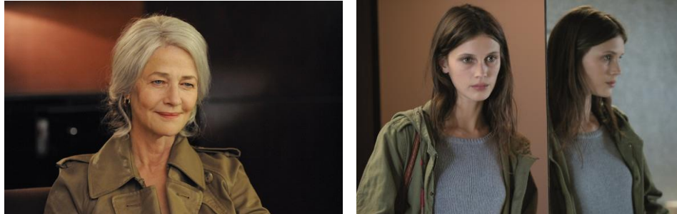
Fig. 8. François Ozon. Jeune et jolie . Película. 93'. Francia. 2013.

a quien deseara pagarlos. “Pero nunca tuve las agallas”, terminó, acercándose a los labios un vaso de whisky.