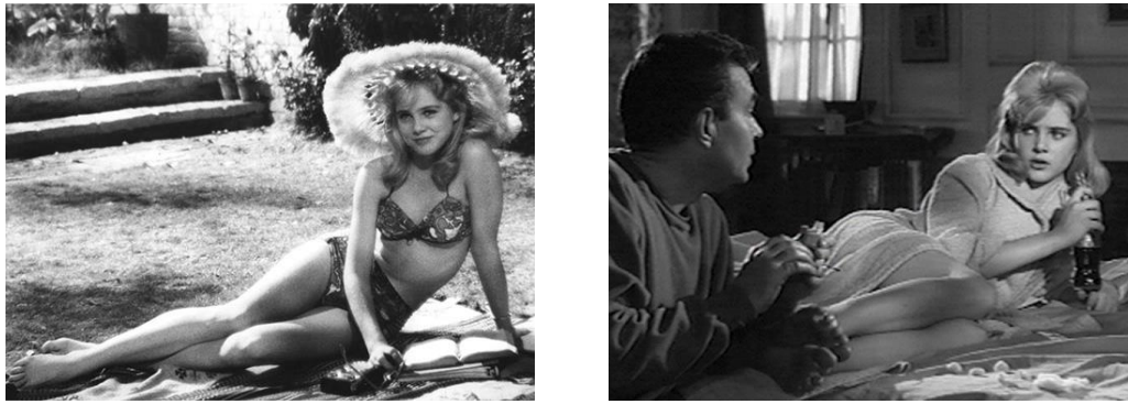
Fig. 14. Stanley Kubrick. Lolita , película, 155', Estados Unidos, 1962.

A pesar de que ambas películas coinciden en colocar como protagonistas a mujeres jóvenes y a focalizar su pasión en un hombre en particular, en Lolita , el personaje principal, Dolores Haze (Sue Lyon), no es más que el objeto de deseo de Humbert (James Mason), además de ser la tercera en discordia dentro de un triángulo amoroso complementado por la madre de la adolescente. Lo que Stanley Kubrick le muestra a su espectador es la fantasía erótica de Humbert , encarnada en una niña que no busca ser instruida en las artes amorosas, su sensualidad, rondando la inocencia, es la respuesta ante el acoso lascivo de su padrastro, algo que además habrá de marcar las relaciones amorosas de la chica a lo largo de su vida.