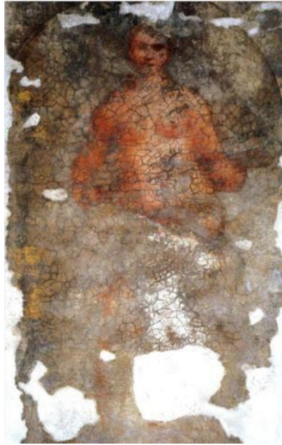
Fig. 6. Giorgione, Desnudo femenino (Venus) , fresco, 1508.

En un periodo histórico en el que el pensamiento cristiano aún mantenía una vigencia e influencia latentes, con una clara aversión al carácter transitorio y frívolo del cuerpo humano, la relevancia de imágenes como la de Giorgione promueven de cierta forma un retorno al culto y la contemplación de la naturaleza, en clara armonía con lo humano a través de un sopor persistente que guarda cierto recelo de la vigilia pero nunca llega a sumergirse por completo en lo onírico, y cuya práctica podría rastrearse a los orígenes mismos de la civilización: