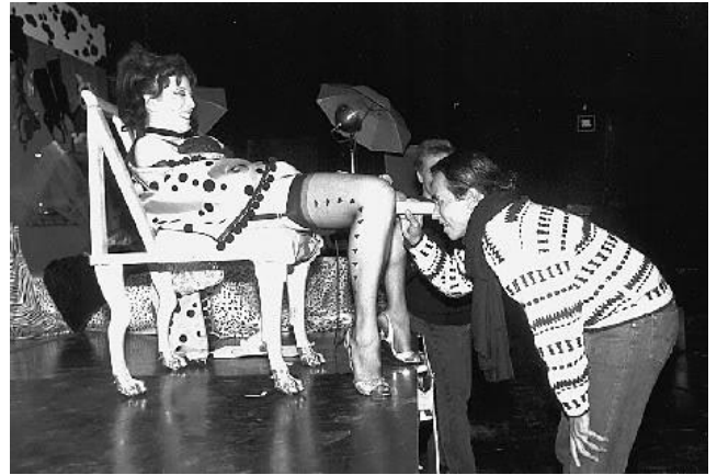
Fig. 16. Annie Sprinkle. The Post-Porn Modernist Show , Proyecto itinerante, 1989 - 1996.

Si bien su visión era más radical, en cuanto a su experiencia artística, que la de Candida Royalle, la teatralización de Sprinkle mantenía vivos los fantasmas del argumento heteronormativo y cosificador de la pornografía tradicional: la mujer, la interprete o protagonista, se exhibía como un objeto sexual presto a brindar entretenimiento a los asistentes; realizaba bailes eróticos similares a los que estaba acostumbrada a hacer en los clubs de desnudistas en los que trabajó; se masturbaba e invitaba al espectador a observarla detenidamente, ginecológicamente si se considera que con la ayuda de una cámara expandía el espectro visual de su cérvix, o hasta donde le permitía al objetivo de captura llegar dentro de su cuello uterino y proyectarlo en una pantalla de casi cuarenta metros cuadrados, o simplemente invitando a la audiencia a mirarlo a través de un telescopio.