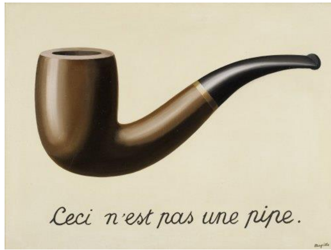
Fig. 21. René Magritte, Ceci n'est pas une pipe , óleo sobre tela, .63 x .93 m., 1929.

Candida Royalle, Annie Sprinkle y Erika Lust han pintado a una mujer en plenitud, hermosa, con sus respectivos poderes sexuales a flor de piel, no sin colocar debajo, imperceptible para el ojo crítico, una proclama, un apercibimiento parecido al situado por el pintor francés René Magritte en la pintura de su pipa (fig. 21): “Esto no es una mujer”.