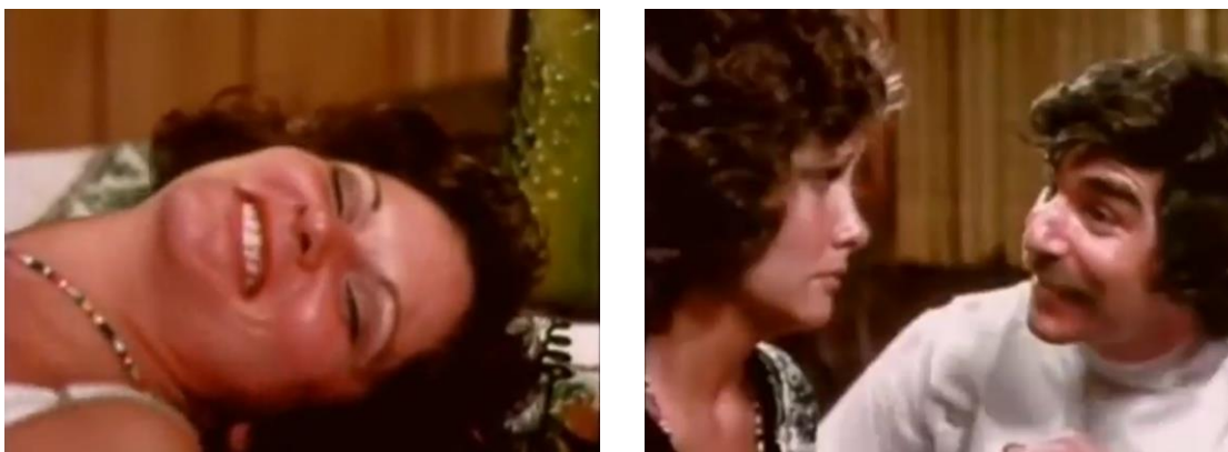
Fig. 9. Gerard Damiano. Deep Throat . Película. 90'. Estados Unidos. 1972.

Para sus adeptos, la película no representó a una ninfómana sino a una chica que desconocía las potencias de su cuerpo; al descubrir el orgasmo, ella simplemente se dedicó a cultivarlo y a la vez convidó su experiencia con sus compañeros sexuales. Por otro lado, sus detractores creyeron que la mujer en cuestión era una víctima de su insaciabilidad sexual: el aparente placer que era capaz de sentir se reducía a la puesta en práctica de la fantasía masculina por antonomasia del porno.