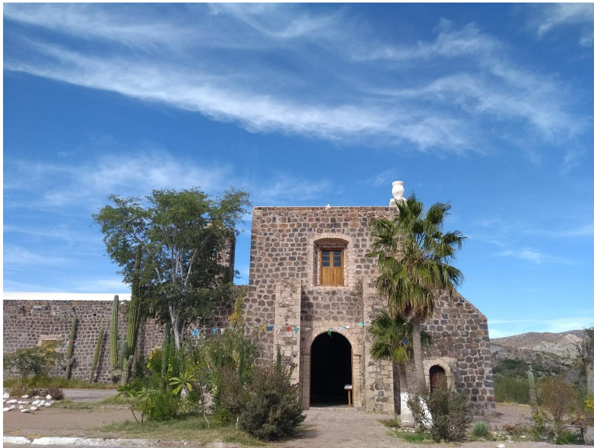
Imagen 9. Misión de Santa Rosalía de Mulegé, en Baja California Sur 60 .