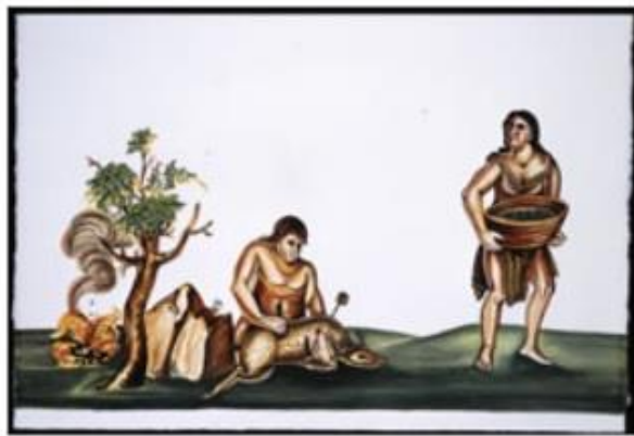
Imagen 5. Conjunto de dibujos elaborados por el jesuita Ignacio Tirsch en donde ilustra a los habitantes de California 56 .