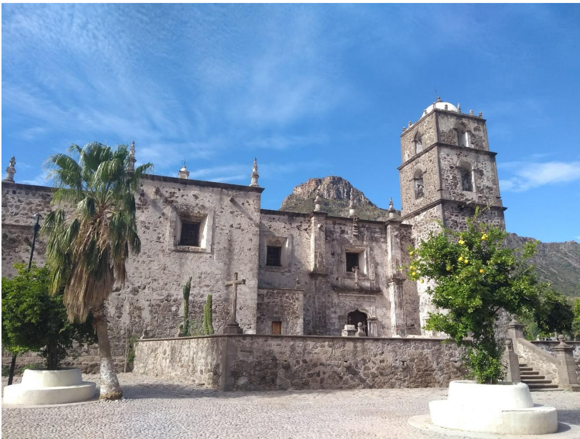
Imagen 7. Misión de San Francisco Javier, en Baja California Sur. 58