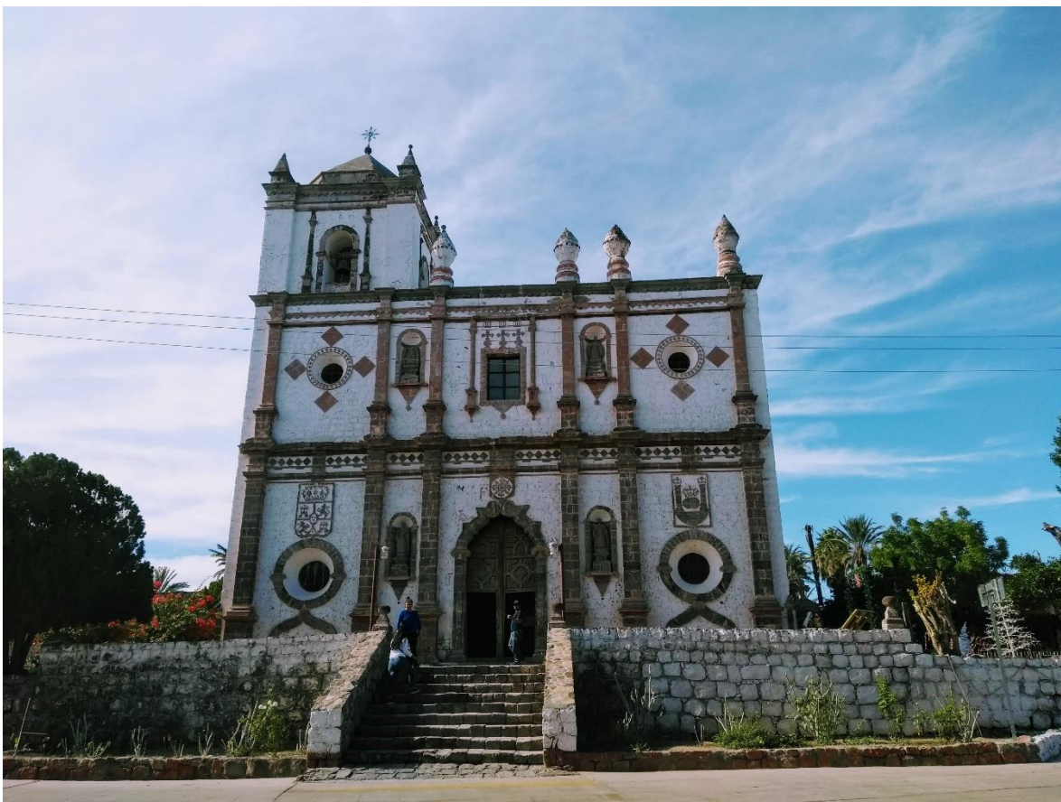
Imagen 6. Misión de San Ignacio Kadakaamán, en Baja California Sur. 57