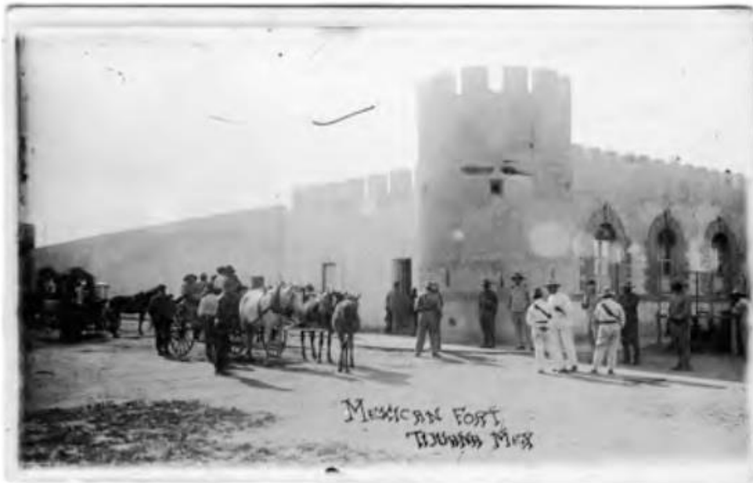
234 "MEXICAN FORT TIJUANA MEX", CAW, tarjeta postal, registro AW0149A, (ca) 1906-1910.