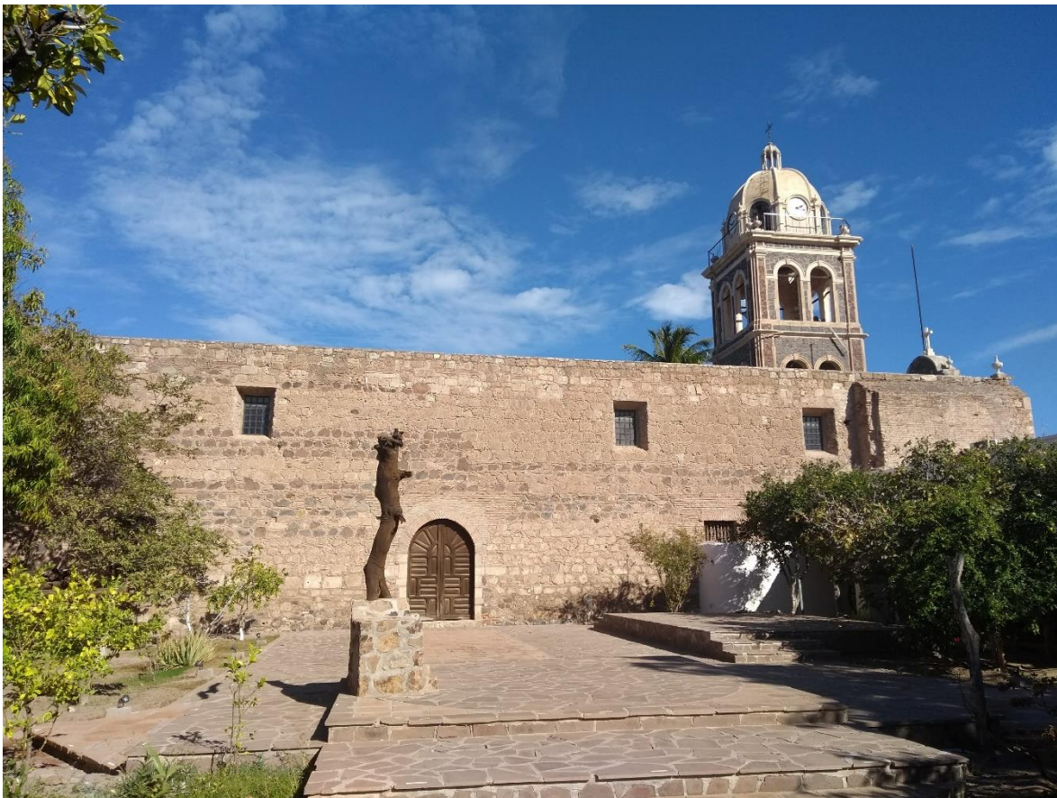
Imagen 8. Misión de Nuestra Señora de Loreto, en Baja California Sur. 59