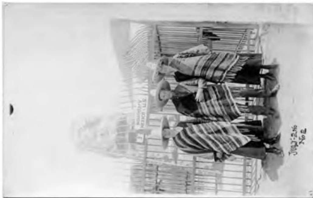
242 "JULY-2ND No2", CAW, tarjeta postal, registro AW0056A, (ca) 1911-1915.