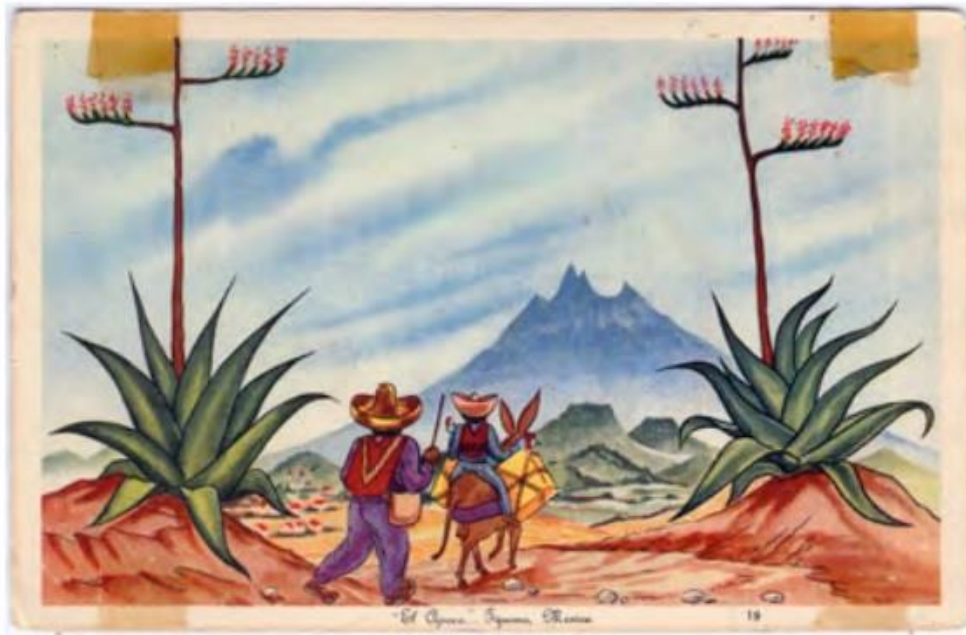
227, "El Ajusco, Tijuana, Mexico", tarjeta postal, registro CAWAHT278A, (ca) 1930-1935.